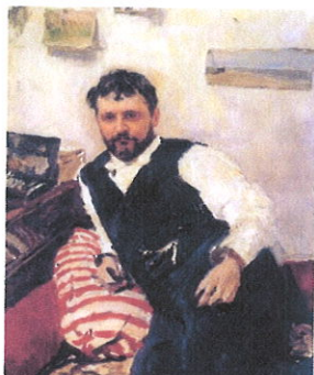
2 кадр. Портрет Серова «Молодой Коровин»

А какое произведение вы читали сегодня дома? (Коровин «баран, заяц и ёж»)