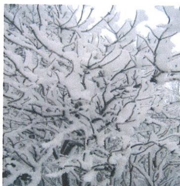
8 кадр - Зимняя веточка

Ребята, 5 февраля мы будем в Русском музее и продолжим знакомство с этим замечательным художником.