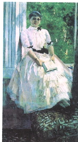
7 кадр - Коровин «Портрет артистки»