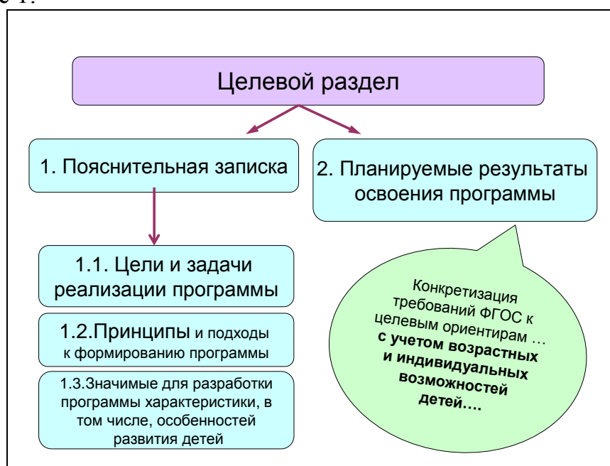
Схема 1. Структура целевого раздела Программы.

Проектирование основной образовательной программы начинается с Целевого раздела. Его структура в соответствии со Стандартом представлена на Схеме 1.