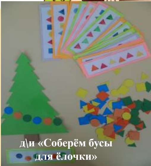
д/и «Соберём бусы для ёлочки»