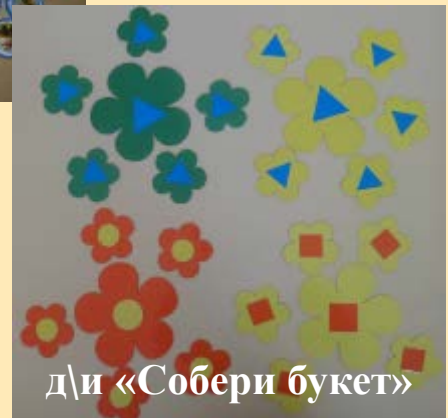
д/и «Собери букет»