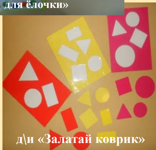
д/и «Залатай коврик»