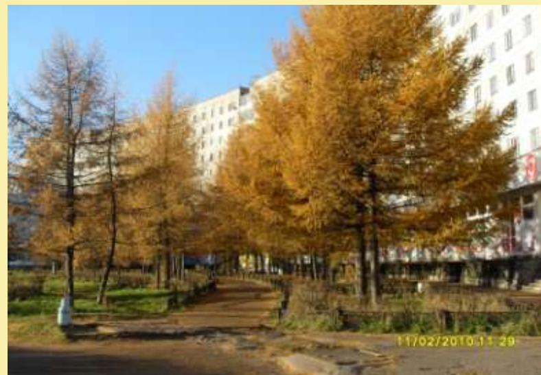
Аллея лиственниц у циркульных домов по ул.Ломоносова.