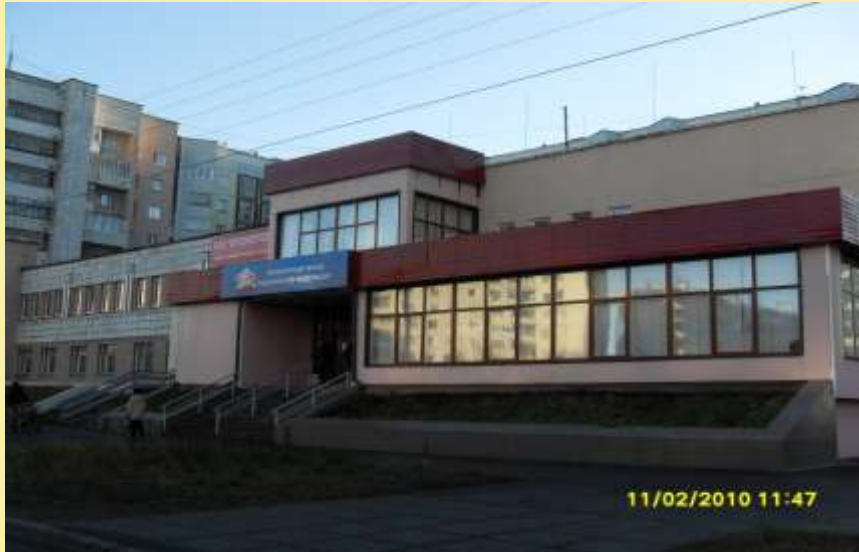
Пенсионный Фонд РФ.