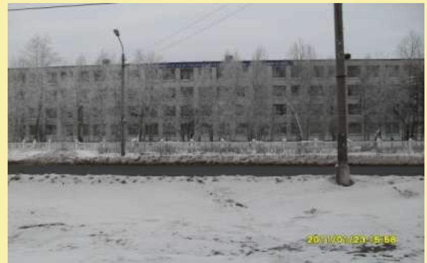
Филологический факультет. Ул. К. Маркса, 36.