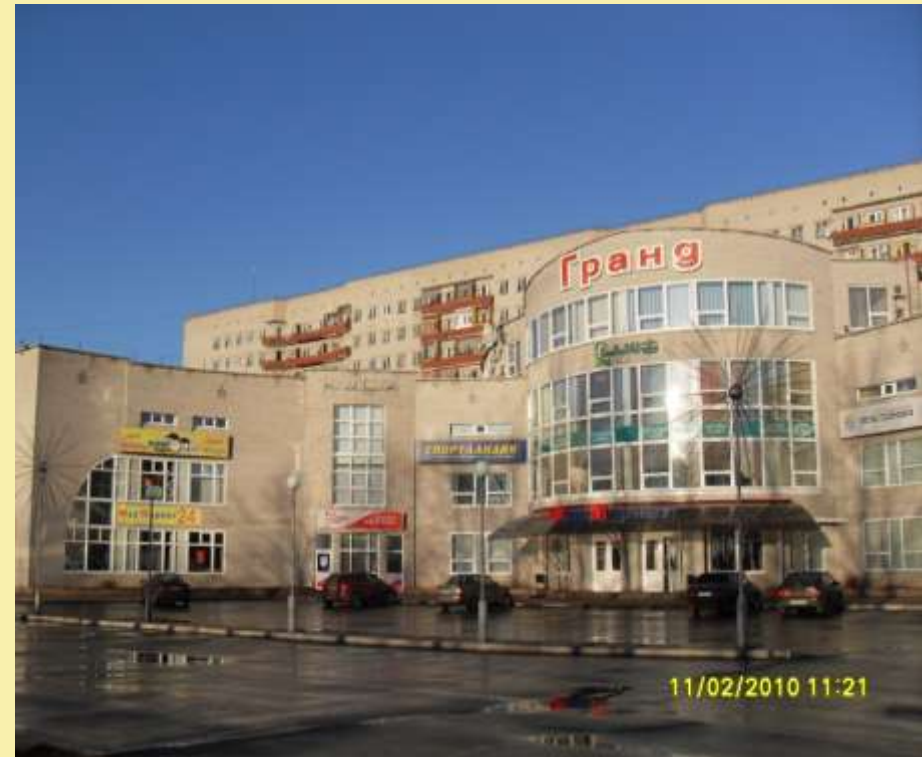
« ГРАНД »