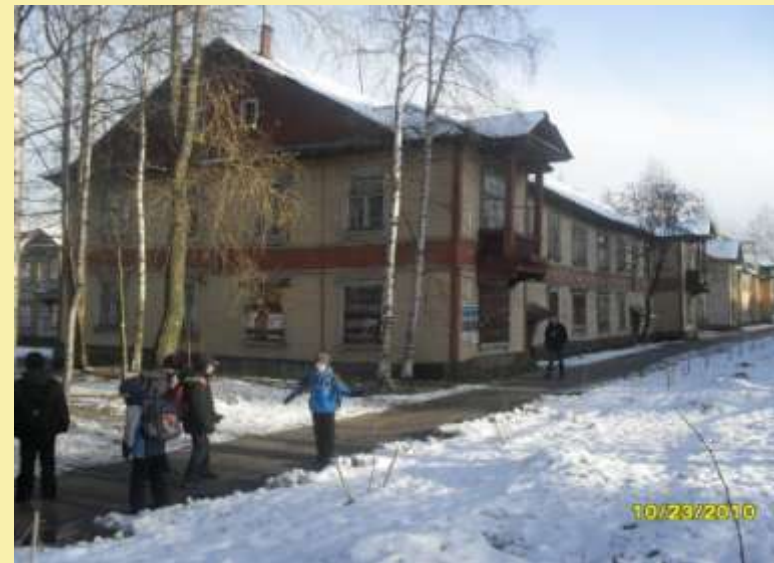
С 7 октября 1938г. Улица называлась Осоавиахимовская. В 1948г. улице дали имя Ломоносова.