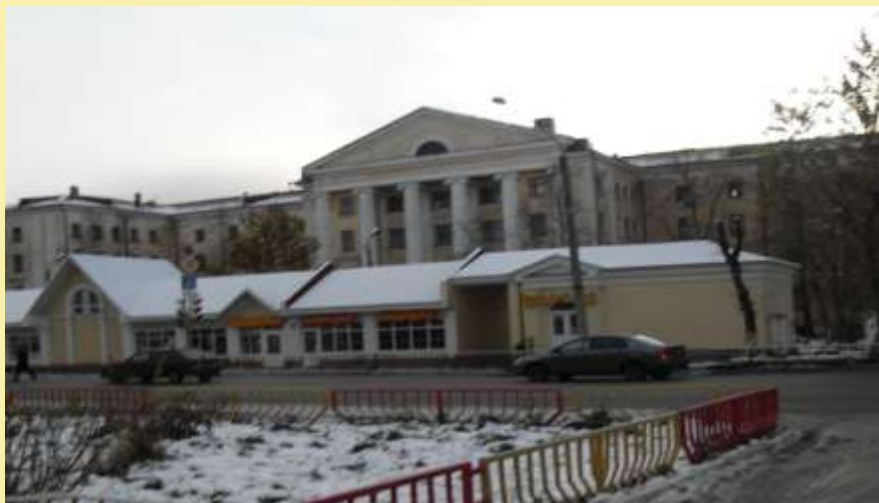
Горбольница №1 – одно из самых старейших больничных зданий в городе.