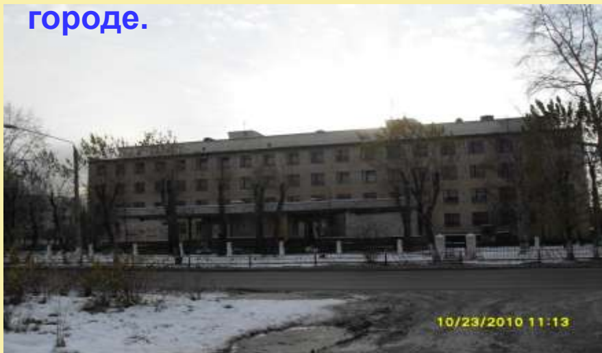
Детская поликлиника №1.