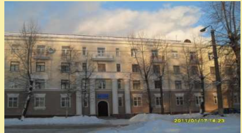
Факультет психологии и педагогики. Ул. Торцева, 6.