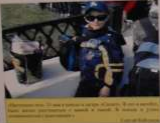
Вот так выглядит наша любимая пляжная жизнь. Дети и взрослые наслаждаются солнцем и морем. А родители в это время занимаются своими делами.