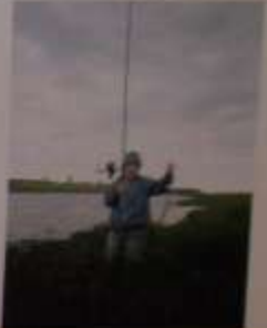
Вот так выглядит наша любимая пляжная жизнь. Дети и взрослые наслаждаются солнцем и морем. А родители в это время занимаются своими делами.