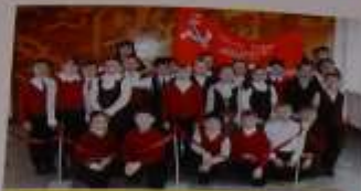
11.09 ребята в школьной газетке рассказали о войне. Поделились воспоминаниями о войне и рассказали о жизни в то время. Мы рассказали о жизни в то время.