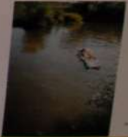
Вот так выглядит наша любимая пляжная жизнь. Дети и взрослые наслаждаются солнцем и морем. А родители в это время занимаются своими делами.