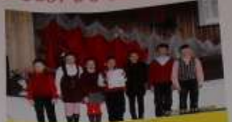
11.09 ребята в школьной газетке рассказали о войне. Поделились воспоминаниями о войне и рассказали о жизни в то время. Мы рассказали о жизни в то время.