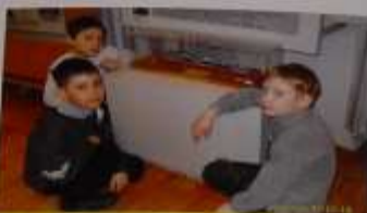
21.09 ребята в школьной газетке рассказали о войне. Поделились воспоминаниями о войне и рассказали о жизни в то время. Мы рассказали о жизни в то время.