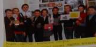
11.09 ребята в школьной газетке рассказали о войне. Поделились воспоминаниями о войне и рассказали о жизни в то время. Мы рассказали о жизни в то время.