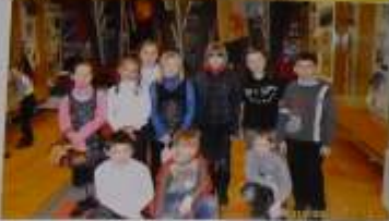
В ДЮСШ ребятами было организовано выступление. Ребята рассказали о войне и рассказали о жизни в то время. Мы рассказали о жизни в то время.