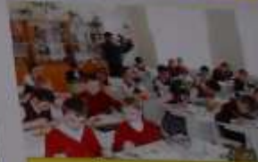
Фильмы, Фильмы, Фильмы! Ребята рассказали о войне и рассказали о жизни в то время. Мы рассказали о жизни в то время.

Впечатления от экскурсии «Молодость в годы Великой Отечественной войны» Впечатления от экскурсии «Молодость в годы Великой Отечественной войны».