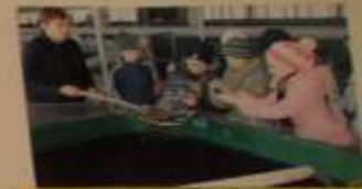
Участники районного конкурса «СЕМЬЯ»