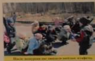
Участники районного конкурса «СЕМЬЯ»