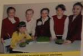
Участники районного конкурса «СЕМЬЯ»