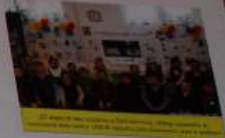
11.09 ребята в школьной газетке рассказали о войне. Поделились воспоминаниями о войне и рассказали о жизни в то время. Мы рассказали о жизни в то время.