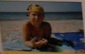
Вот так выглядит наша любимая пляжная жизнь. Дети и взрослые наслаждаются солнцем и морем. А родители в это время занимаются своими делами.