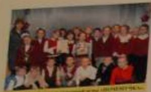
Участники районного конкурса «СЕМЬЯ»