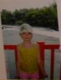
Вот так выглядит наша любимая пляжная жизнь. Дети и взрослые наслаждаются солнцем и морем. А родители в это время занимаются своими делами.