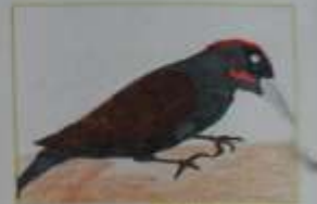
№2 Николай Давид