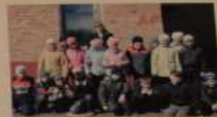
Участники районного конкурса «СЕМЬЯ»