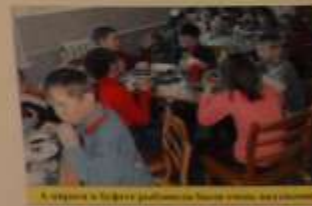
Участники районного конкурса «СЕМЬЯ»