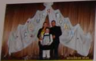
Семья года - 2010. Ребята рассказали о войне и рассказали о жизни в то время. Мы рассказали о жизни в то время.