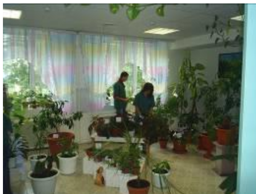
Работа в теплице