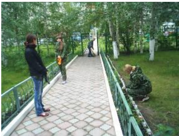
Уборка территории Центра детского творчества