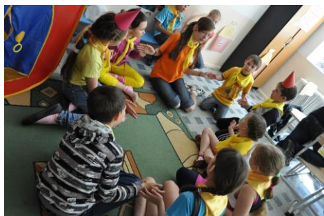
Вожатые ЛТО «Панама»