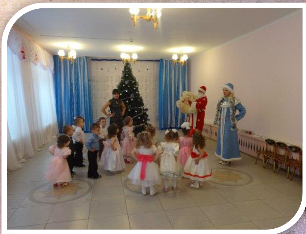
Рисунок 7 Новогодний утренник «Со зверюшками в гости к Деду Морозу и Снегурочке»