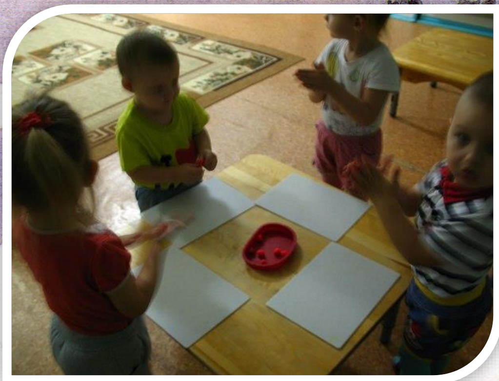
Рисунок 6 Лепка «Снежные комочки»