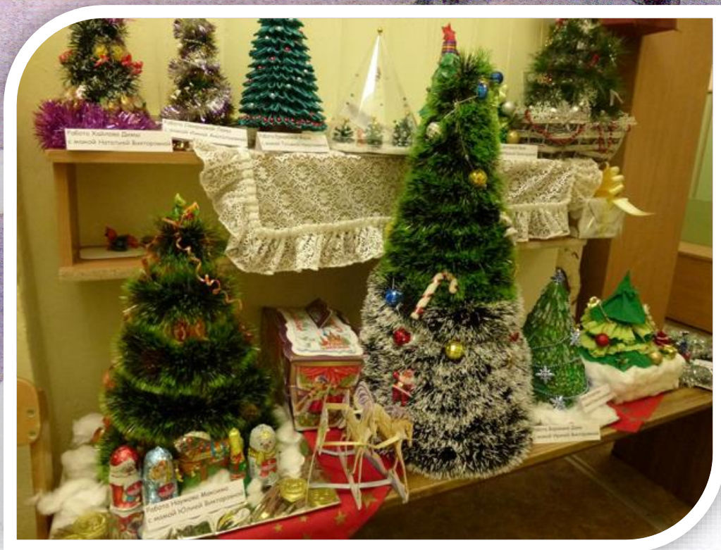
Рисунок 10 Итоги конкурса «Лучшая новогодняя елочка»