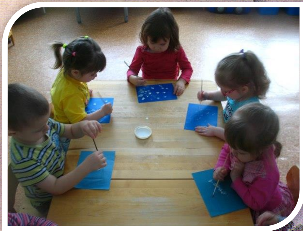
Рисунок 1 Изобразительная деятельность. Тема: «Снег идет»