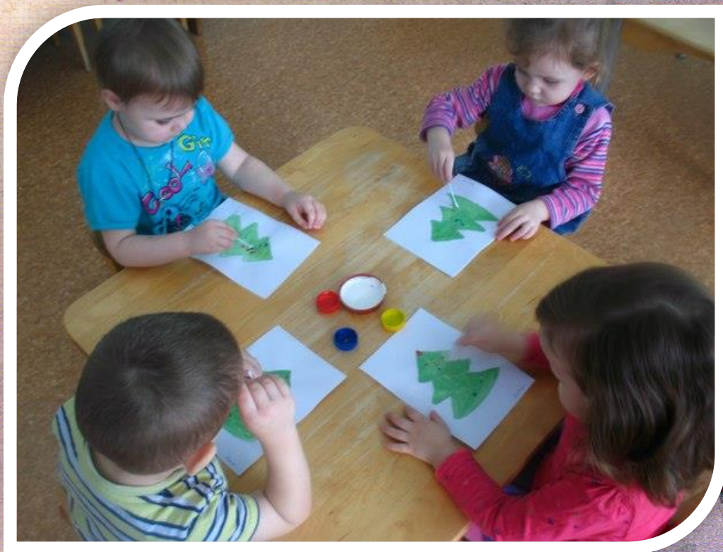
Рисунок 5 Изобразительная деятельность (рисование) Тема: «Украсим ёлочку разноцветными игрушками»