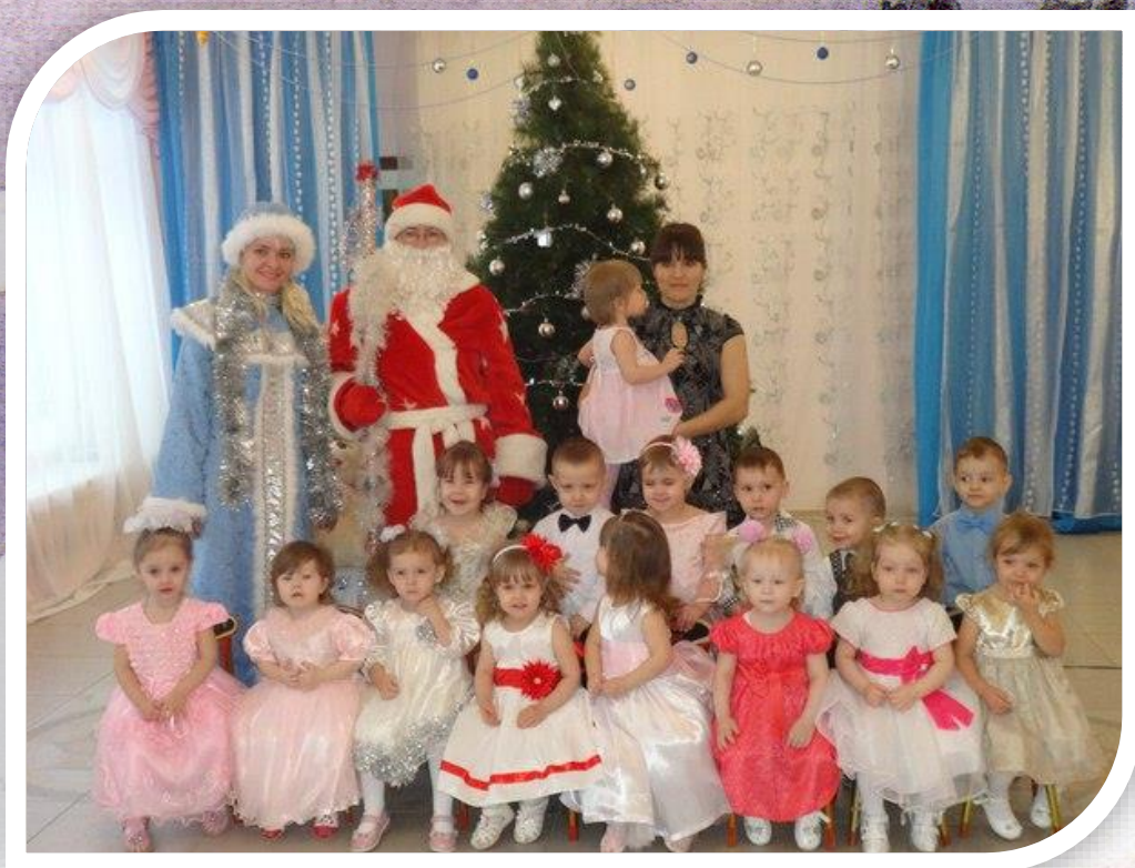
Рисунок 8 Новогодний утренник «Со зверюшками в гости к Деду Морозу и Снегурочке»