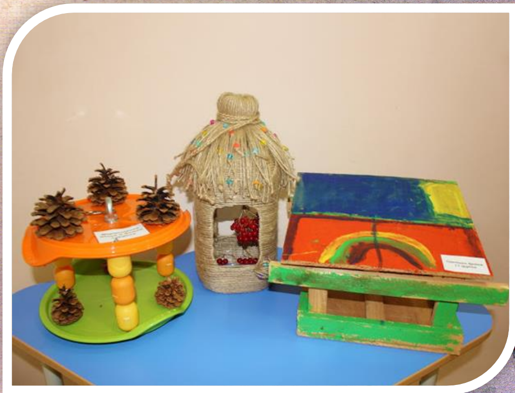
Рисунок 9 Итоги конкурса «Лучшая кормушка»