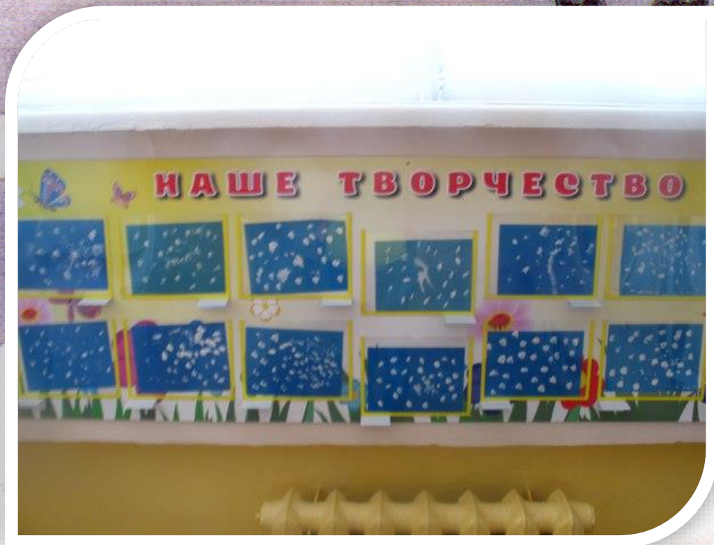
Рисунок 2 Выставка рисунков по теме «Снег идет»