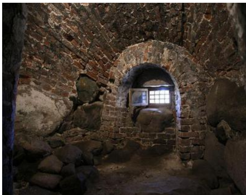
Камера в монастырской тюрьме.

В 1920 на территории монастыря располагается лагерь принудительных работ, который вместе с конвоем насчитывал 350 человек. В 1923 был