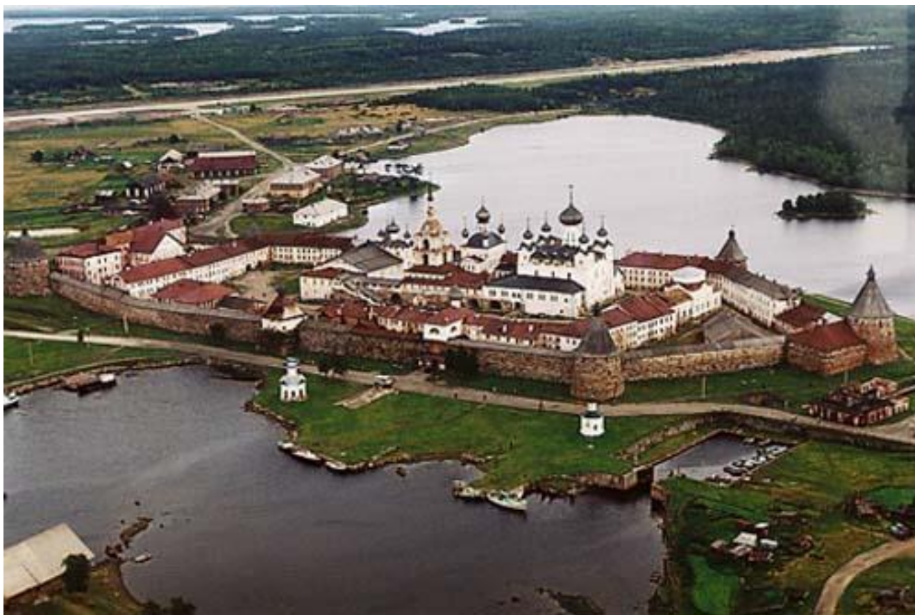
Вид на Соловецкий монастырь с высоты птичьего полёта.