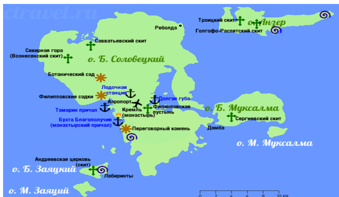
Карта соловецких островов, расположенных в Белом море.

Соловецкий архипелаг, Северная Фиваида, или Северный Афон, как еще принято называть эти заповедные места – группа островов у входа в Онежский залив, в юго-западной части Белого моря, единственного внутреннего моря Северного Ледовитого океана. Белое море, которое в старину называли еще морем Студеным, Гандвиком, пучиной Соловецкой, – одно из самых интересных по своему происхождению, фауне и флоре. Ниже представлена карта Соловецкого архипелага. Это Большой Соловецкий остров, площадь которого составляет 225 кв. км. К востоку от него расположены Анзер (48,5 кв. км), Большая и Малая Муксалма (19,9 и 0,6 кв. км соответственно), к западу – Большой и Малый Заяцкие острова, площадью