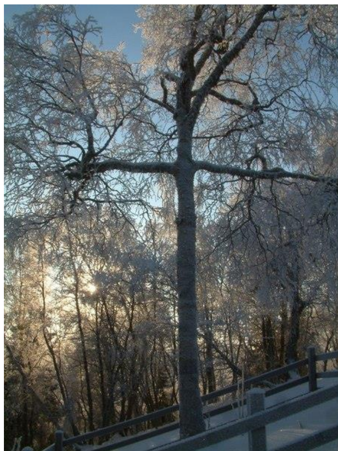
Берёза в виде креста на острове Анзер.

Но самое удивительное место — остров Анзер. Человек, который побывал на Соловках, но не посетил Анзер, многое потерял. Соловки — глубинка, но Анзер — глубинка в квадрате, там люди до сих пор на лошадях ездят. Вот где настоящий русский Север. Там же находится знаменитая берёза в виде креста, выросшая во времена ГУЛАГа.