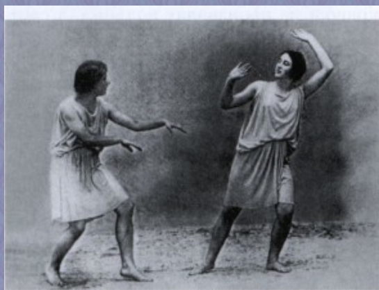
Ритмическая гимнастика Э. Жак-Далькроза.

Была реализована швейцарским педагогом и музыкантом Эмилем Жаком Далькрозом (1865-1950 гг.), который разработал систему музыкально-ритмического воспитания детей. Он видел в музыкально-ритмических упражнениях универсальное средство развития у детей музыкального слуха, памяти, внимания, выразительности движений, творческих способностей.