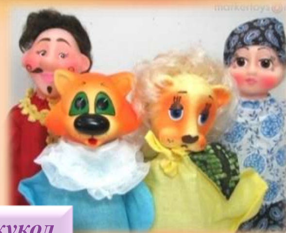
Театр кукол бибабо