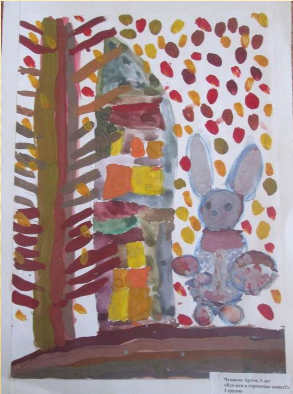
Чушико Артём, 5 лет «Кто-то в теремочке живет?» 1 группа