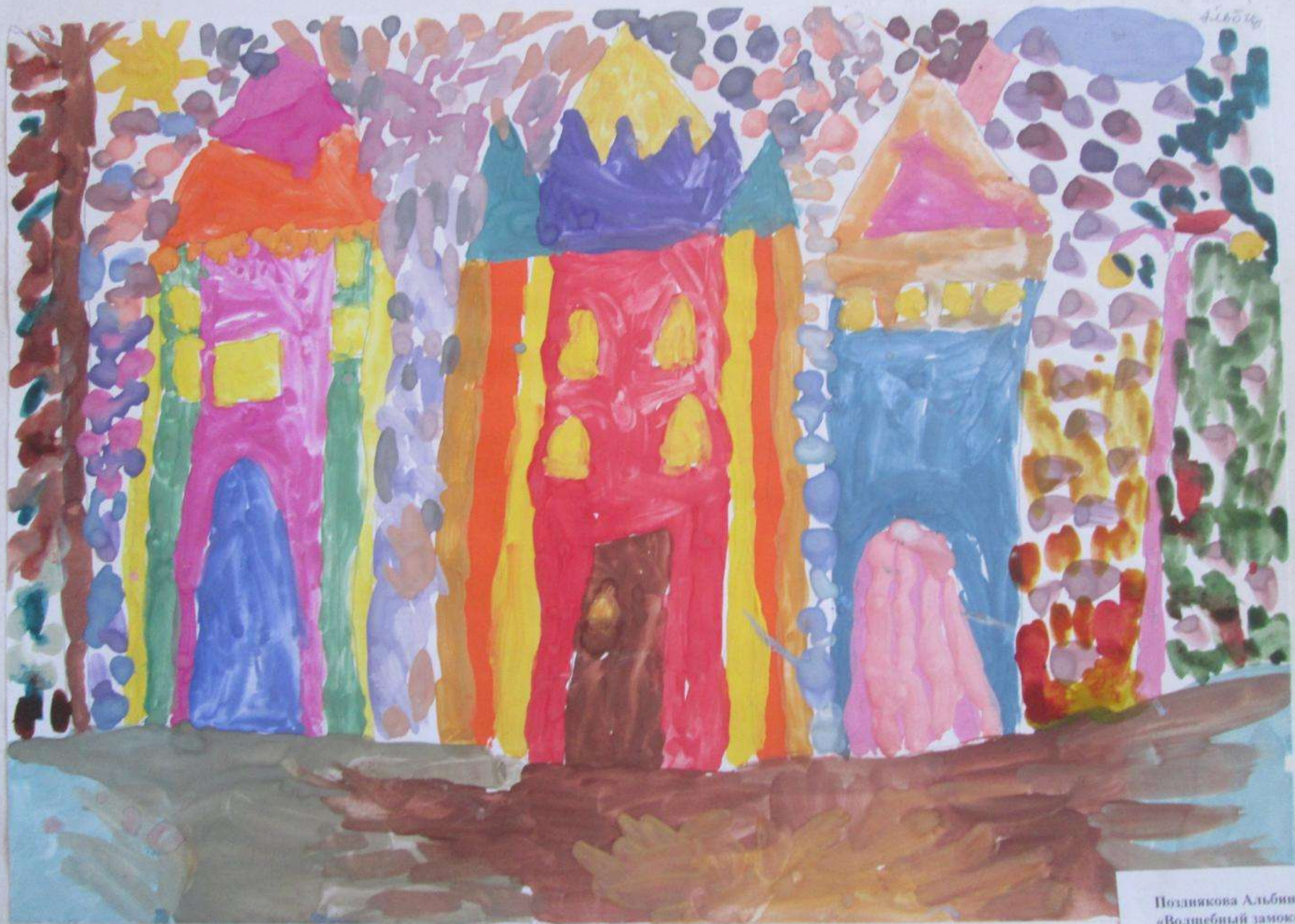
Позднякова Альбина 5 «Волшебный замок» 1 группа