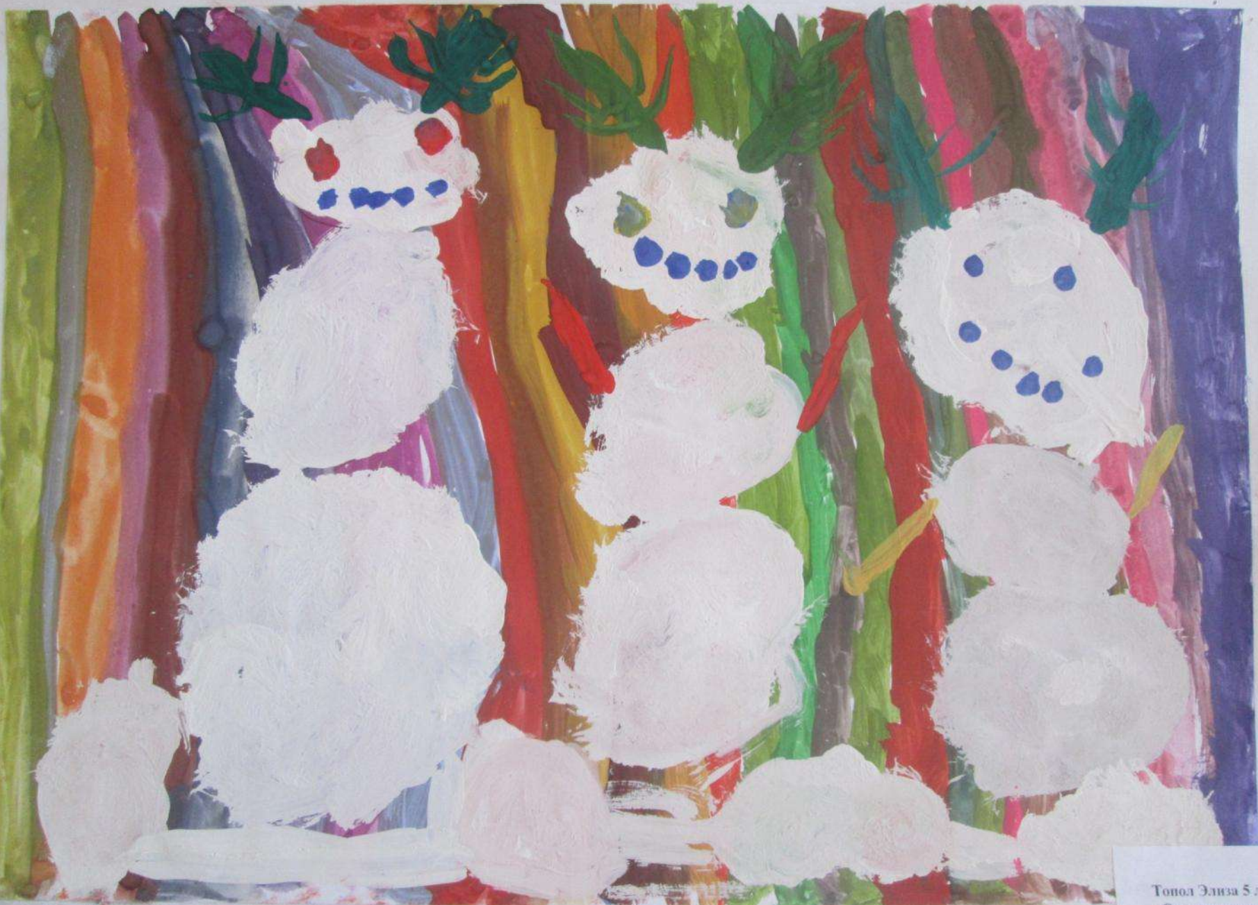
Топол Элиза 5 лет «Семья снеговиков» 1 группа