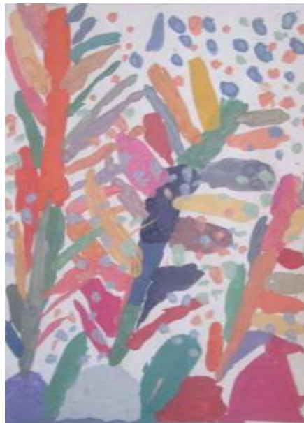
Рисунок 3 «Радостный лес» Осинцев Дима, 5 лет