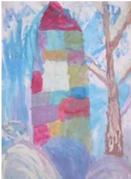
Рисунок 1 «Домик в лесу» Топол Элиза, 5 лет