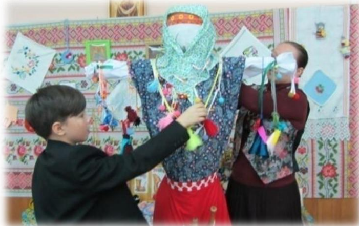
Мастер-класс по изготовлению кукол.

Во время праздника ученики 3-х и 4-х классов учились изготавливать традиционную куклу Параскеву, пели народные песни.