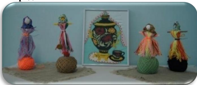
Выставка "Куклы Параскевы" Работы учащихся 3 - 4 классов