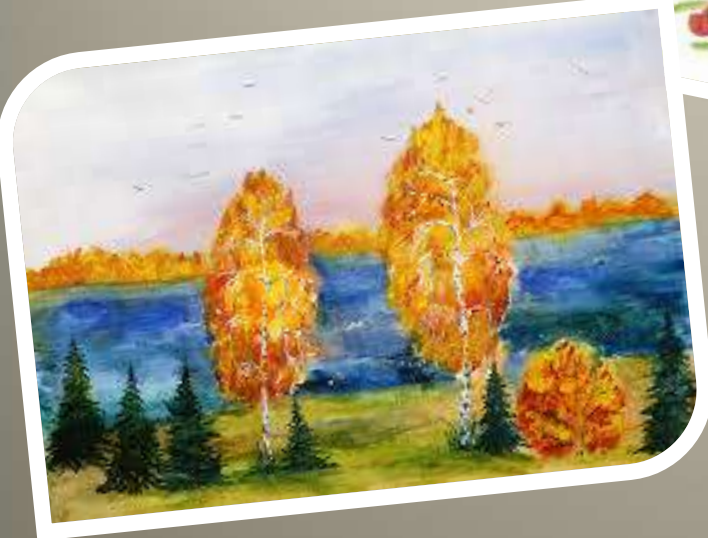
«Мой край марийский»