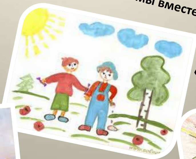
« Мы разные, но мы вместе».