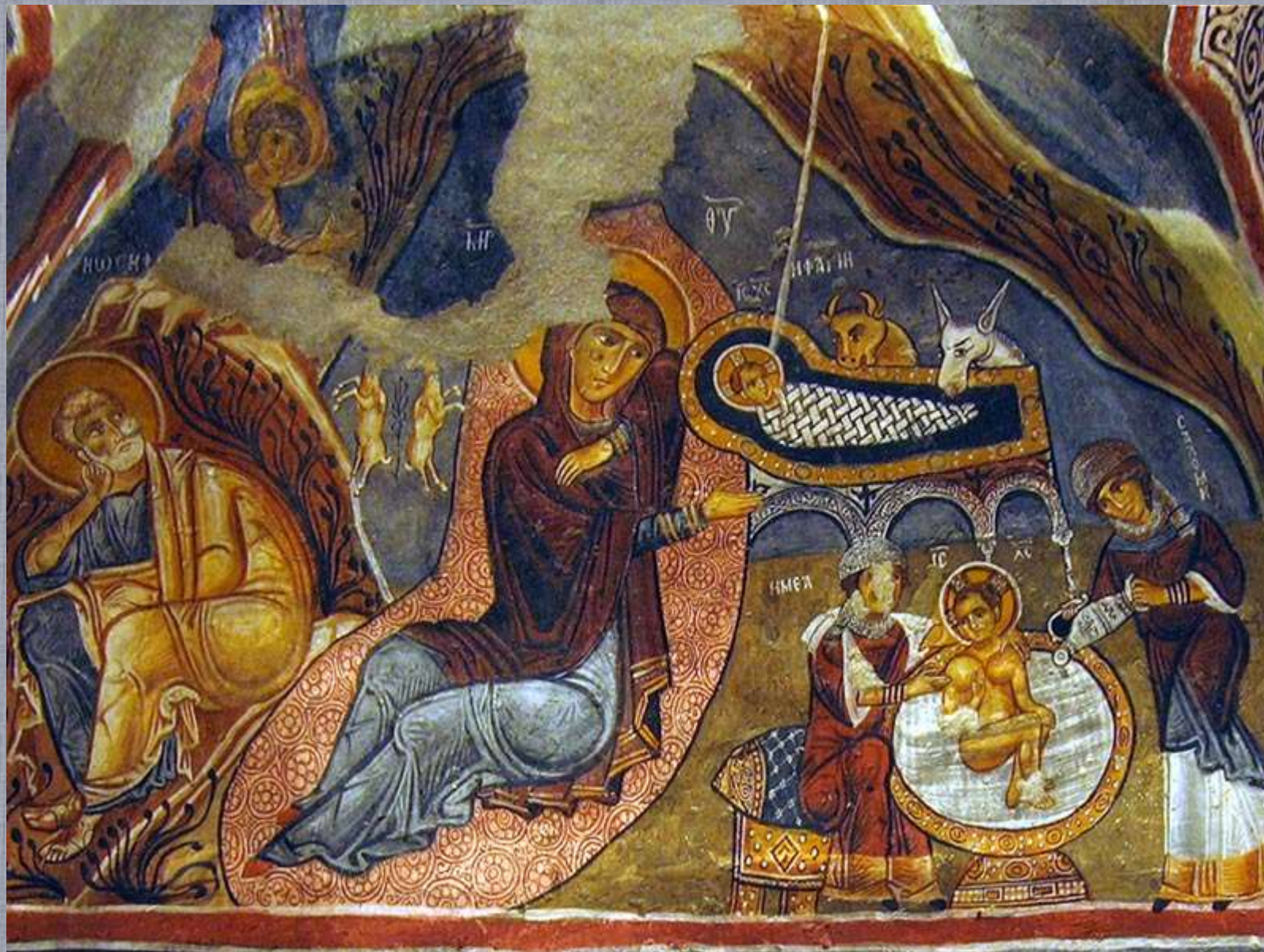
Фреска пещерной церкви Каранлик. XI-XIII в. Каппадокия, Турция