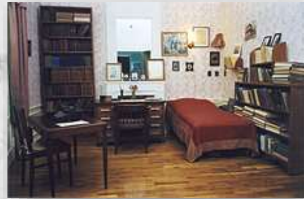
Парижский кабинет Бунина