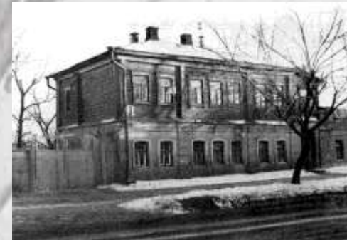
Дом в Воронеже