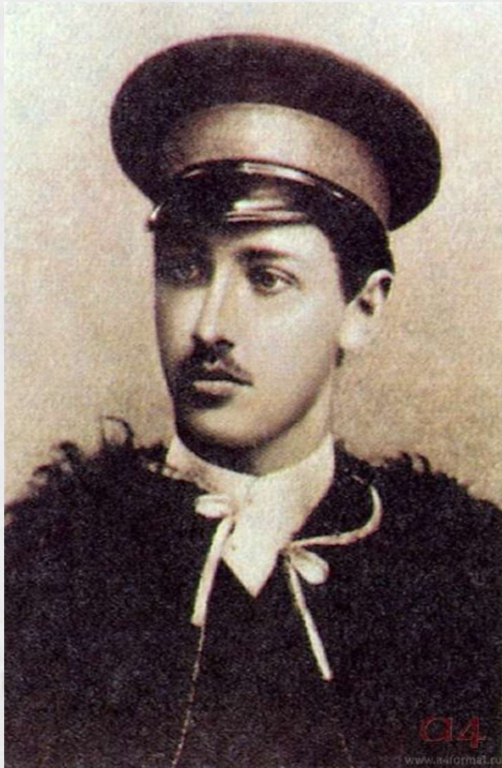
И.А. Бунин. Фото 1890