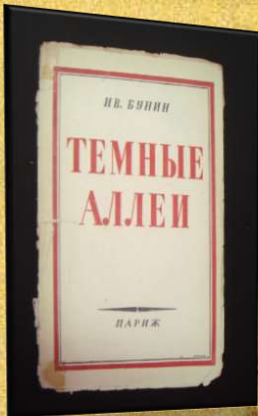
«Темные аллеи» (1938)

Тема любви - одна из постоянных тем в искусстве и одна из главных в творчестве И.А. Бунина.