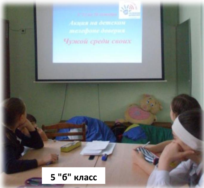
5 "б" класс