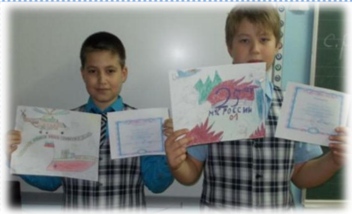
25 лет МЧС.