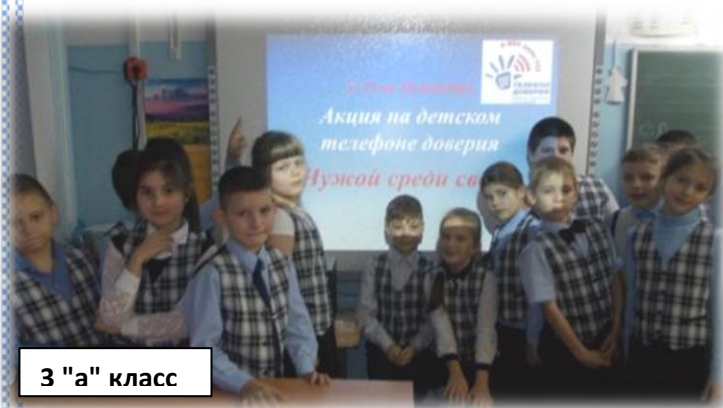
3 "а" класс

Общероссийская линия Детского телефона доверия 8-800-2000-122