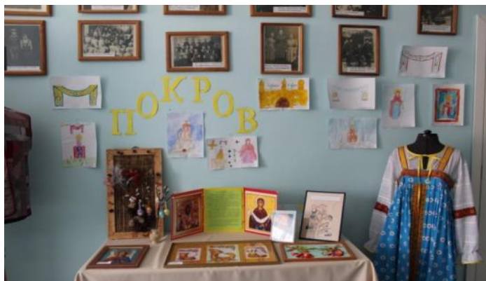
Воспитанники вокального ансамбля «Затея»