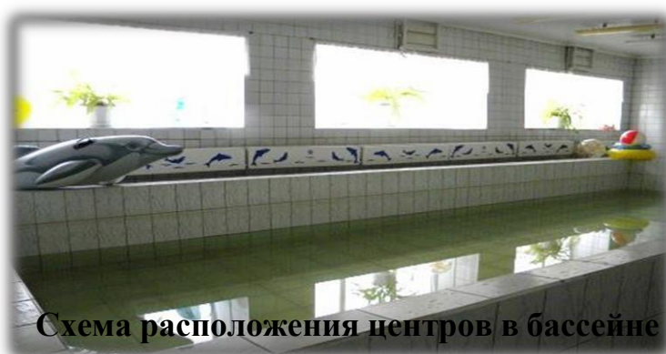
Схема расположения центров в бассейне