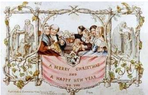
Открытка 1843 года

Рождественский сюрприз удался: открытка умела невероятный успех не только у близких семейства Коулов, но и у многочисленных знакомых. Предприимчивый чиновник решил отпечатать дополнительные экземпляры открытки и продавать каждую по шиллингу. Позже эти открытки пошли в серийное производство.