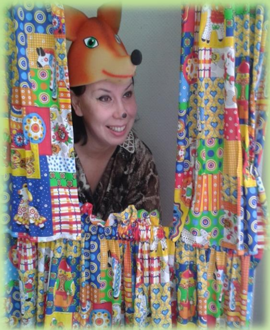
Работа над образом