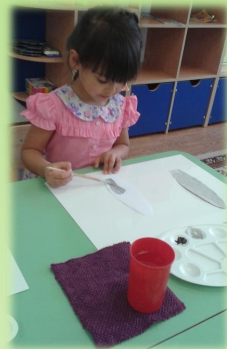
Изготовление «Заячьих ушей»