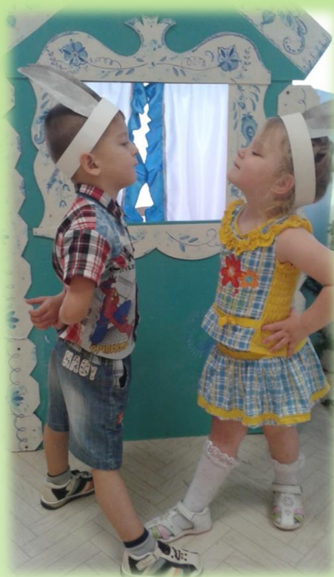
Этюд «Смелый заяц»