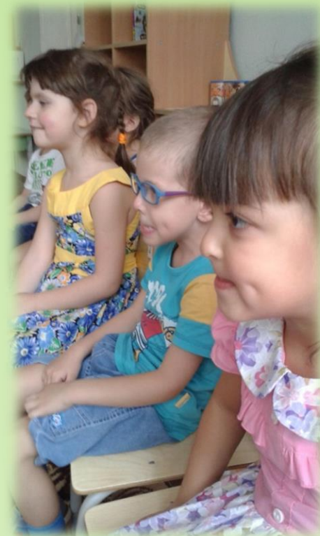
Этюд на выражение основных эмоций