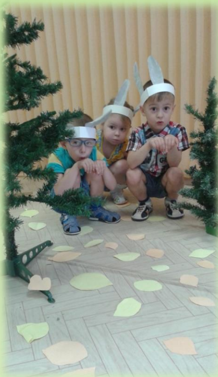
Инсценировка «Зайки серые»