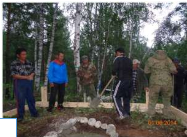
Закладка основания субургана