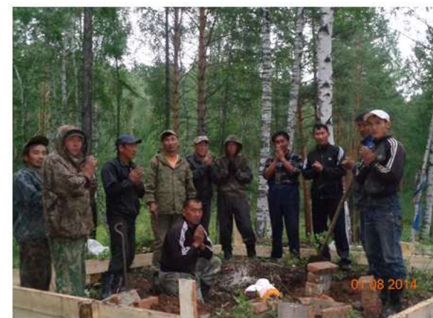
Обряд БУМБЭ НЮУЛГА