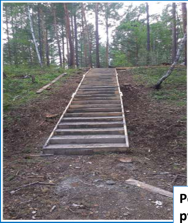
Лестница к статуе Будды Шакьямуни