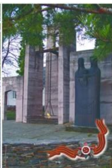
Памятник односельчанам, не вернувшимся с ВОВ. сел. Бирагзанг. 1995г.