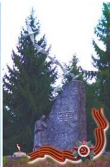
Памятник семи братьям Газдановым, погибшим на фронтах ВОВ. сел. Дзуарикау, шоссе Владикавказ-Алагир. 1975г.

41. Памятник доблестным сынам Куртатинского ущелья, не вернувшимся с Великой Отечественной войны. Открыт в 1970 году. Расположен у сел. Барзикау. Автор: скульптор Д.А. Цораев.