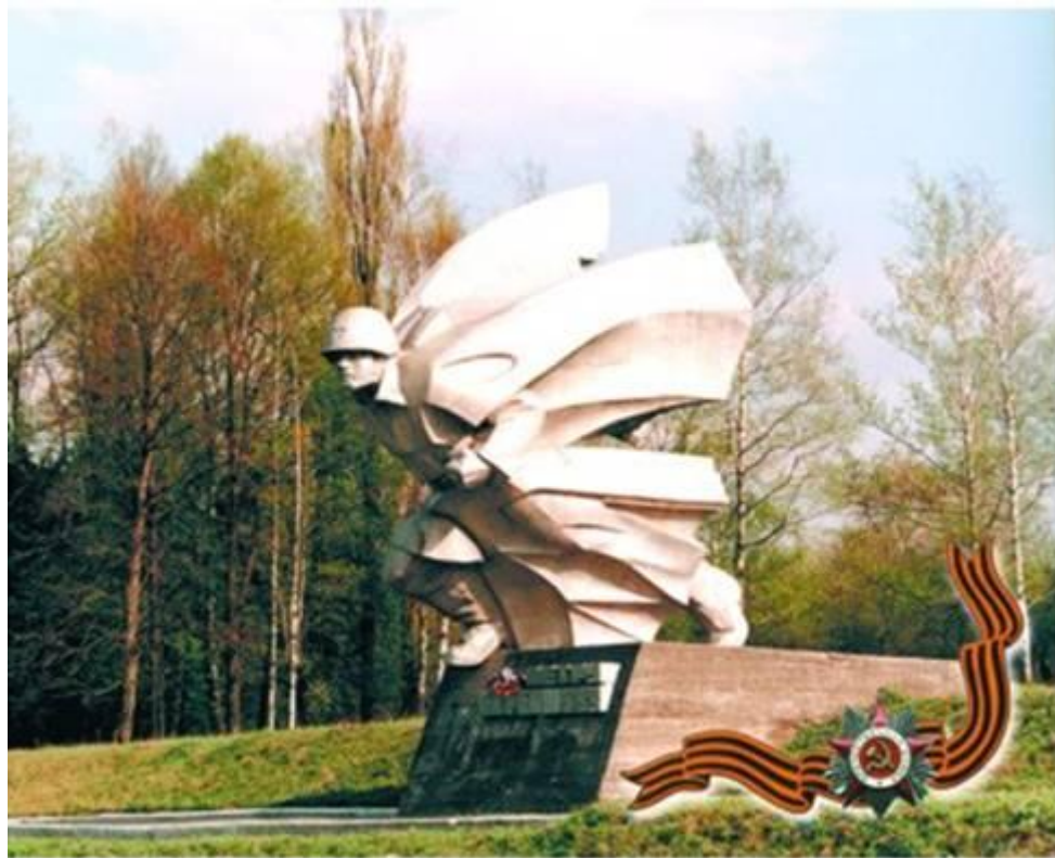
Памятник Герою СССР Петру Барбашову – Командиру отделения 34 мотострелкового полка. Шестой километр шоссе Владикавказ-Алагир, у сел. Гизель. 1983г.