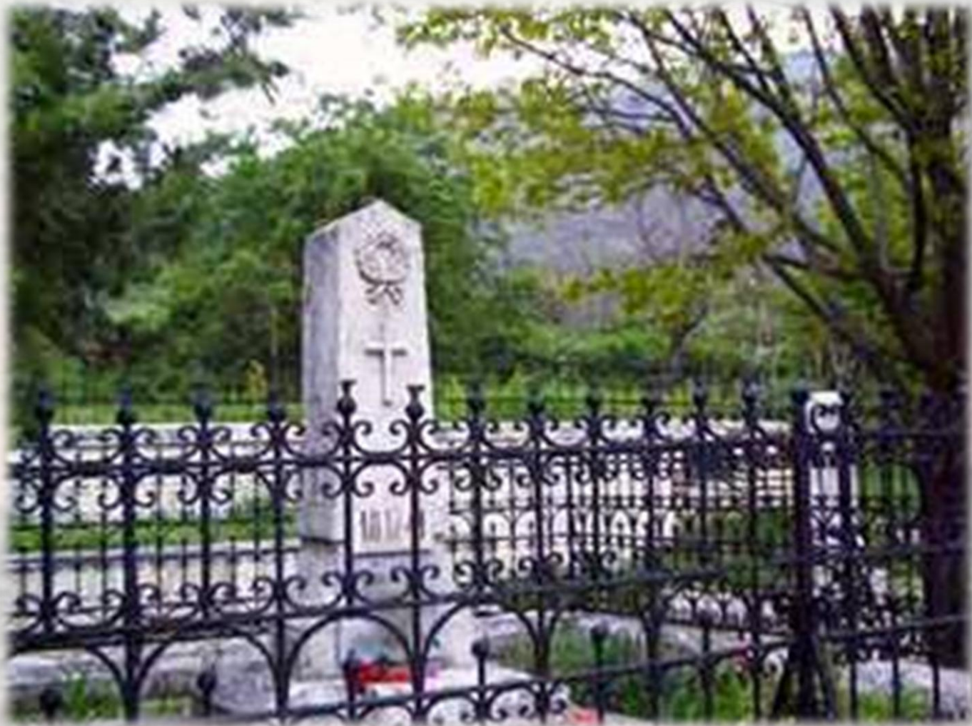
Место первоначального погребения Лермонтова в Пятигорском некрополе