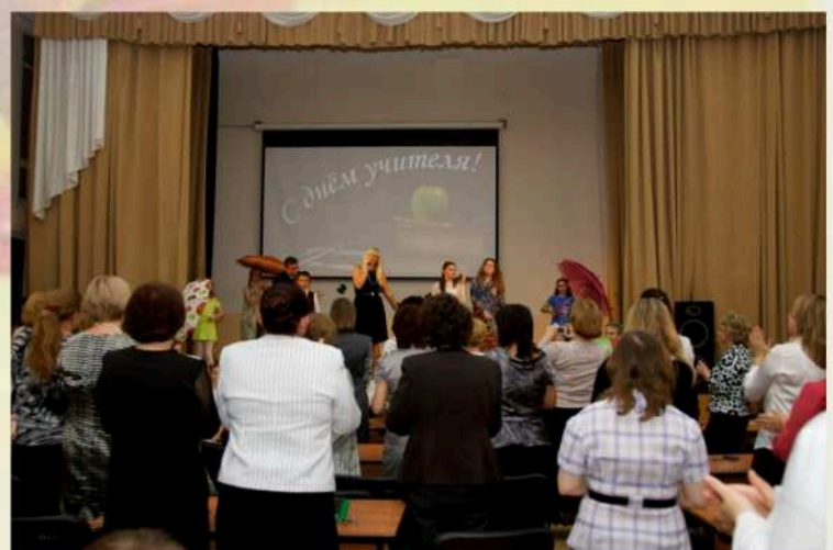
"ЭТОТ МИР" вокальная студия