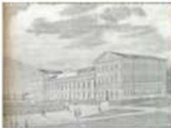
Нежинский лицей. Акварель О.В. Визеля. 1830-ые гг.

В 1818-1819 гг. Гоголь вместе с братом Иваном обучался в Полтавском уездном училище. С 1821 по 1828 гг. будущий писатель обучался в гимназии высших наук в г. Нежин Черниговской губернии. Здесь он познакомился с современной литературой, увлёкся театром.