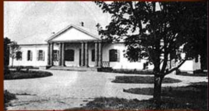
Родительский дом в Васильевке