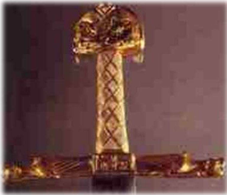
Рукоятка меча Карла Великого