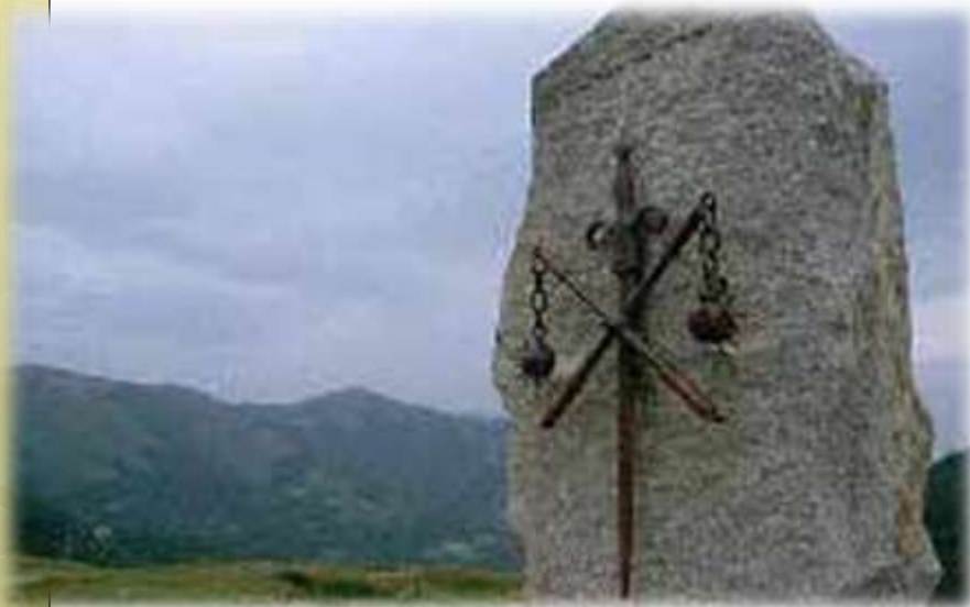
Памятник погибшим франкам в Ронсельванском ущелье

В 778 году Карл воспользовался призывом о помощи испанских мусульман из Сарагосы, боровшихся за независимость от эмира Кордовы из династии Омейядов, и его многочисленное войско, набранное из подвластных и союзных народов, перешло через Пиренеи. Эта кампания, что редко случалось с Карлом, оказалась неудачной. На обратном пути, когда войско двигалось растянутым строем, как к тому вынуждали горные теснины, баски устроили засаду в Ронсельванском ущелье на вершинах скал и напали сверху на отряд, прикрывавший обоз, перебив всех до последнего человека. Среди погибших был племянник Карла маркграф Бретанской марки Роланд.