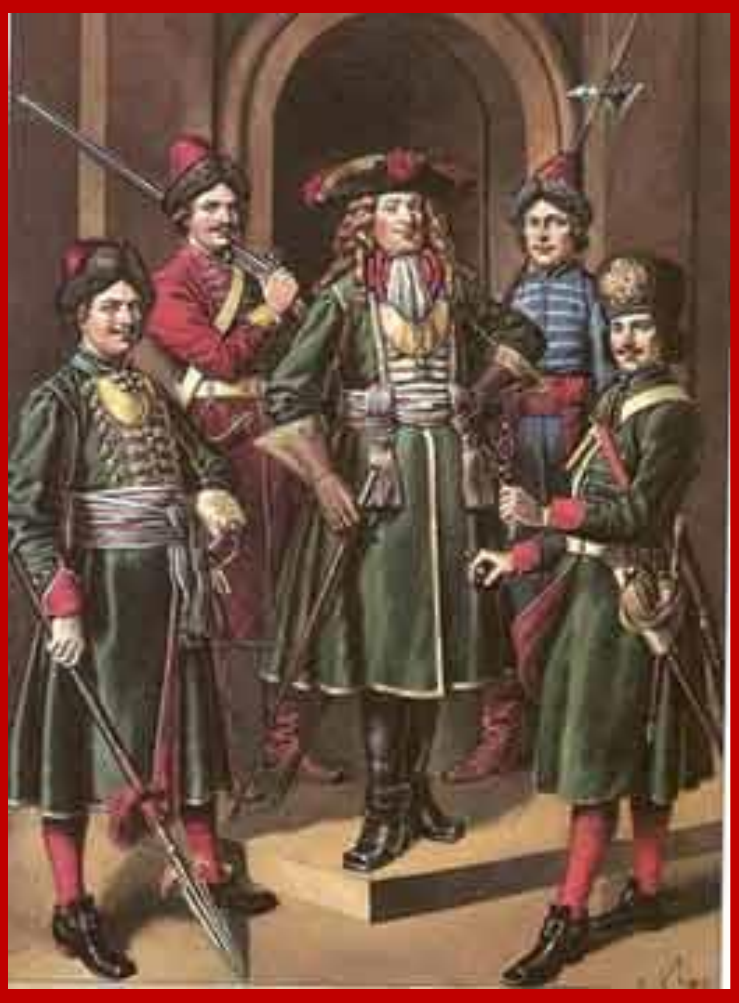
С. Летин "Служилое платье от Петра Великого. Гвардейские мундиры"