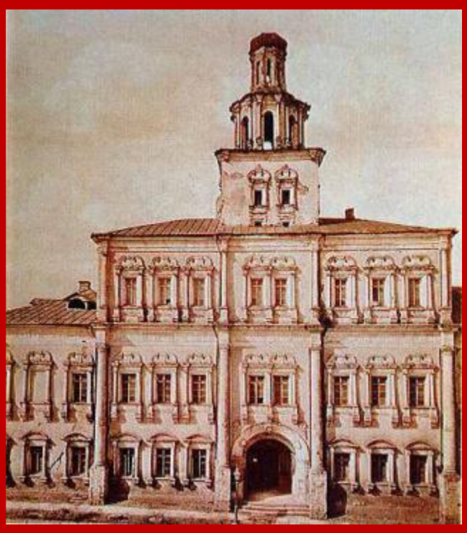
Первое здание Московского университета