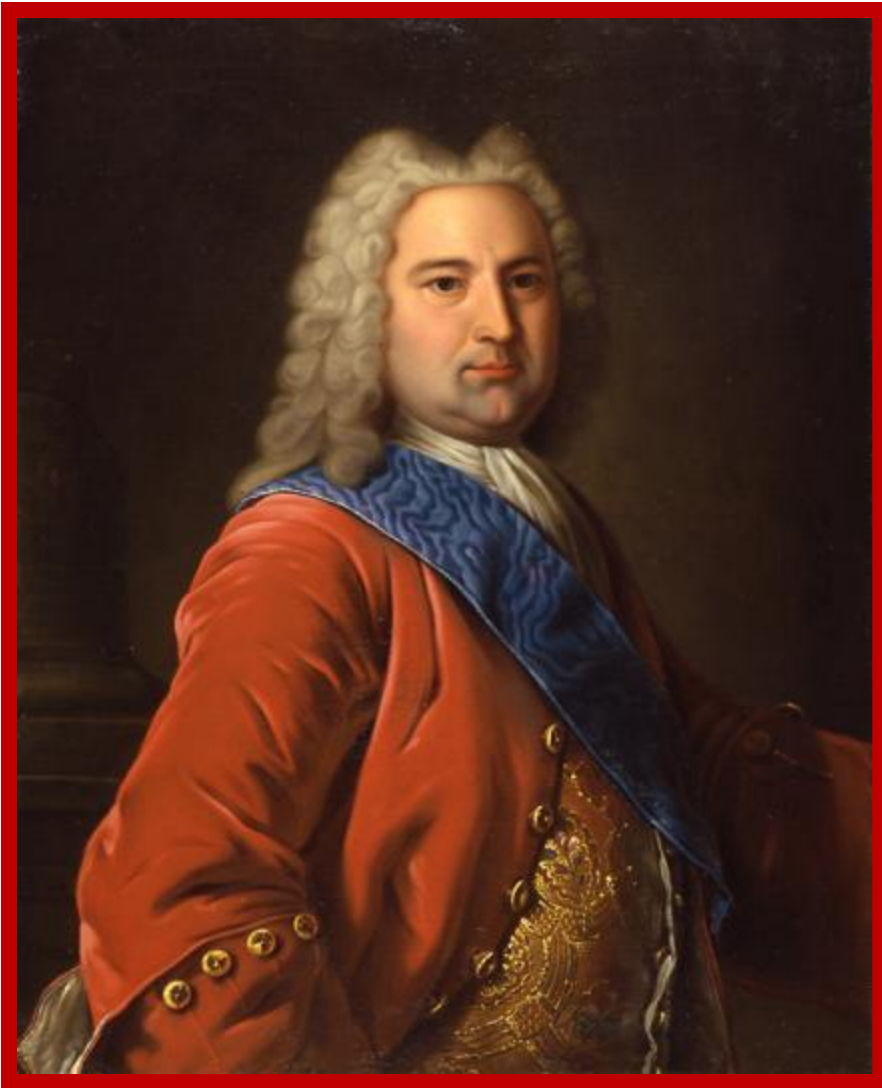
Эрнст Бирон – фаворит Анны Иоанновны