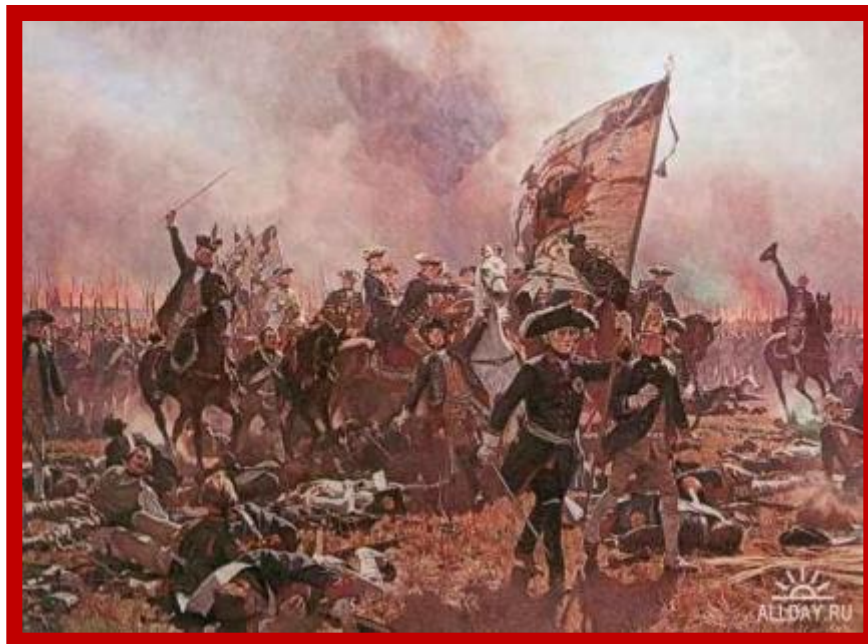
Сражение у Цорндорфа

1761 г. – смерть Елизаветы Петровны. Петр III заключил с Фридрихом II союз против своих бывших союзников и вернул Пруссии все завоевания.