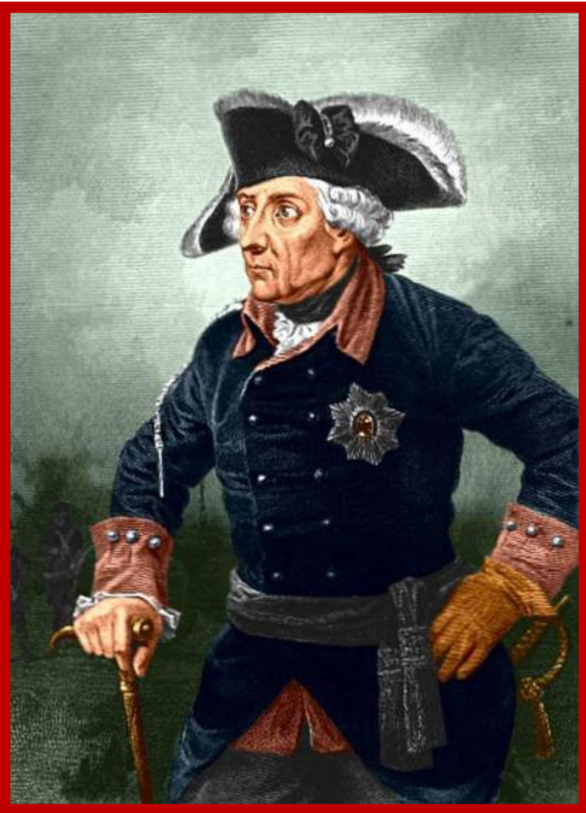
Прусский король Фридрих II

24 апреля 1762 года - Петербургский мирный договор между Россией и Пруссией, заключённый Петром III, поклонником Фридриха II Прусского.