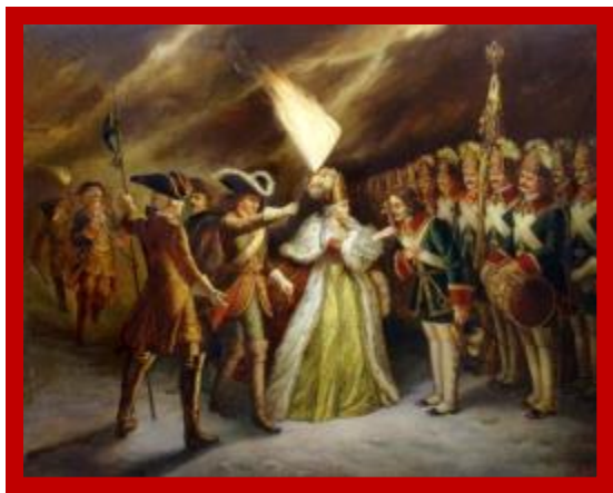
Филипп М.Р. Присяга преображенцев дочери Петра Великого.