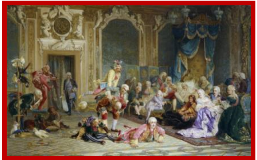
Якоби Валерий Иванович. Шуты при дворе императрицы Анны Иоанновны.

1730-1740 гг. - правление Анны Иоанновны Племянница Петра I, вышедшая замуж за герцога Курляндского, прозвище «Кровавая», «Митавская затворница».