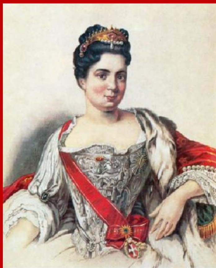
Екатерина I Алексеевна. (1684-1727)