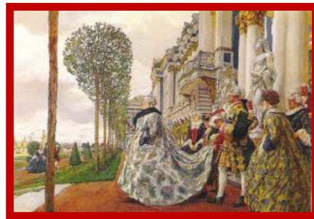
Императрица Елизавета Петровна в Царском Селе Е. Е. Лансере