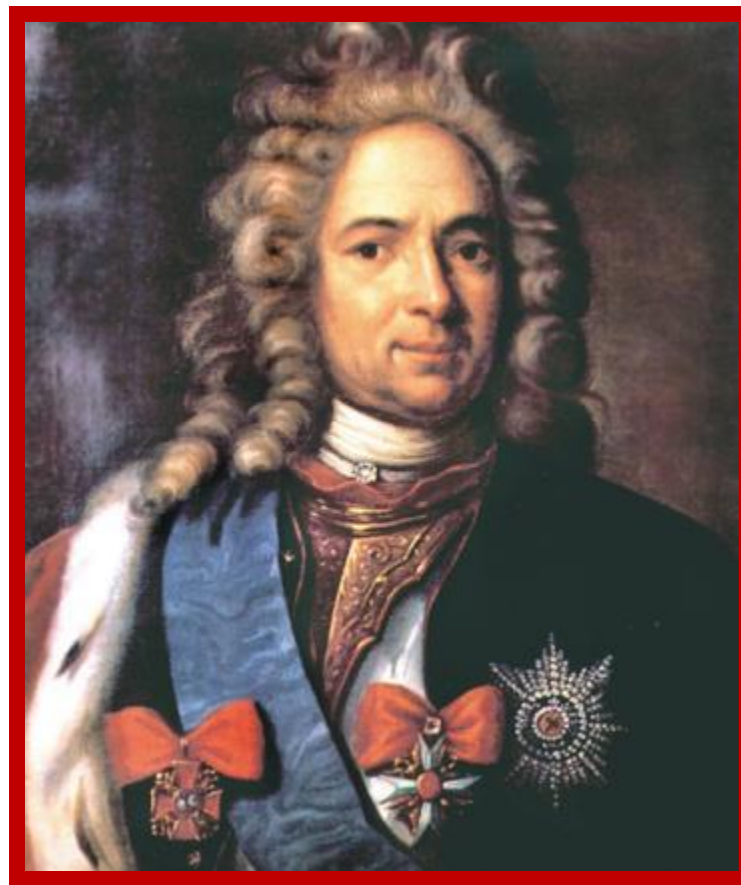
Александр Данилович Меншиков