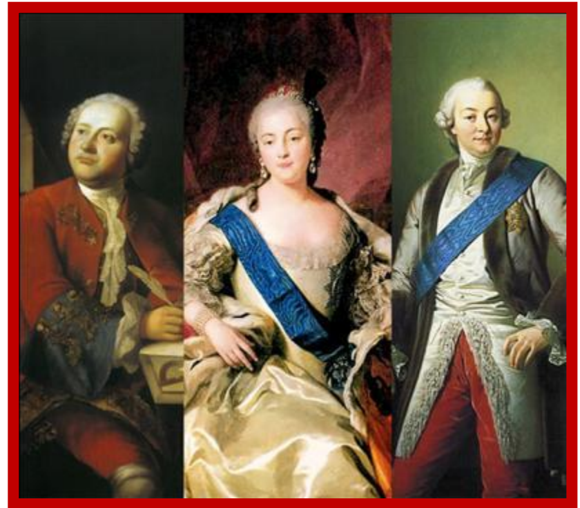
Михаил Васильевич Ломоносов, императрица Елизавета Петровна, Иван Иванович Шувалов.