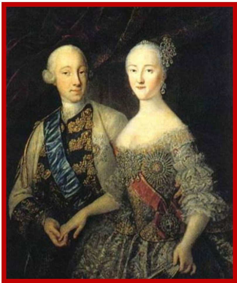
Петр Федорович, великий князь, Екатерина Алексеевна, великая княгиня.