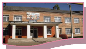
МБОУ СОШ №6 им.Ф.И.Ярового ст.Новолеушковской