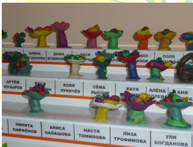
Лепка «Фрукты в вазе»