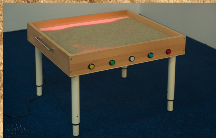
Стол с подсветкой