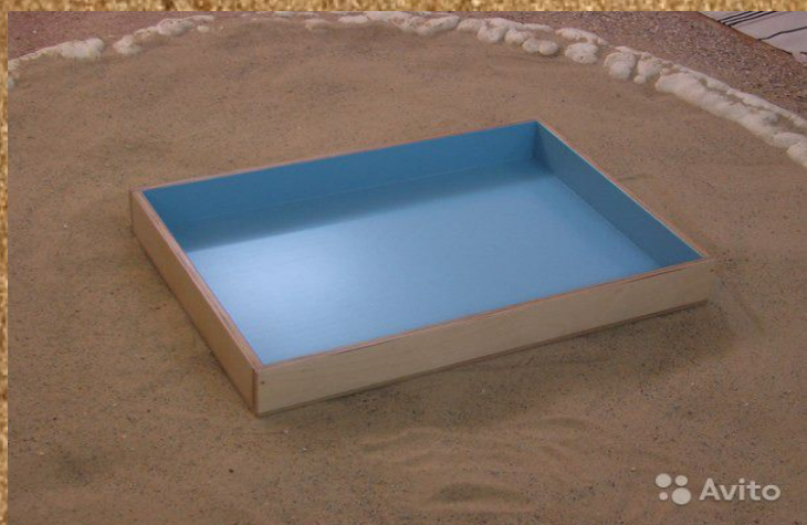
Деревянный ящик размером 50x70x10 см.