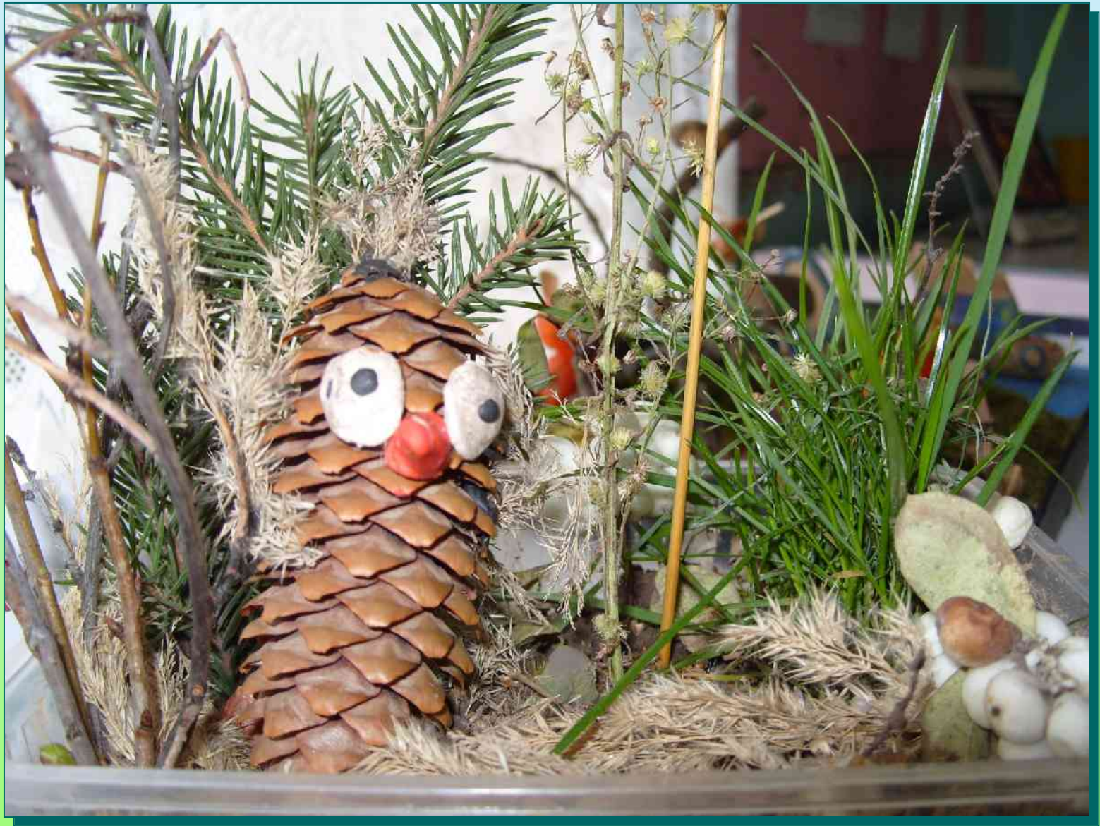
Совместная поделка к акции «Ёлочка – зеленая иголочка»