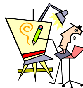
Art and craft

Следите, чтобы дети проговаривали слова, пока рисуют.