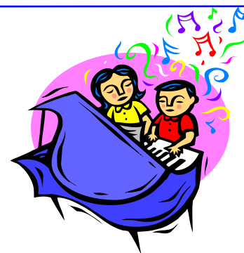
Listen and sing

- head, затем—shoulders, и так до toes. Затем вновь спойте песню со всеми словами.