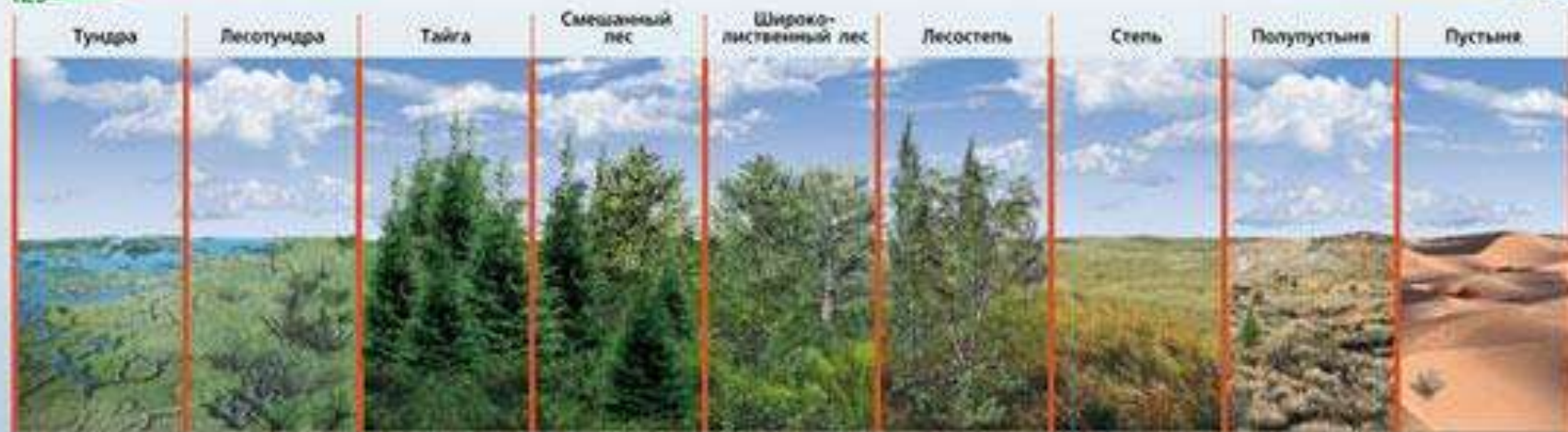
Толщина гумусового горизонта