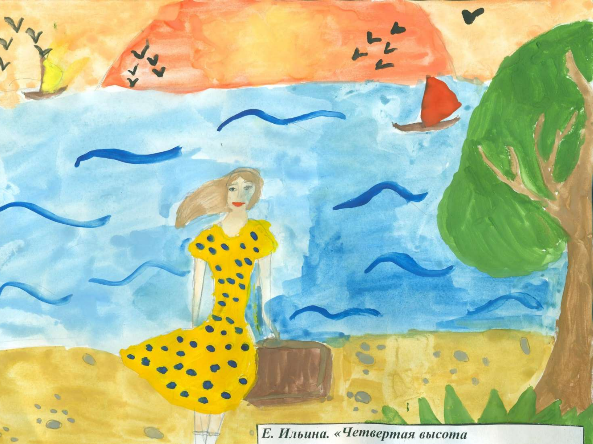
Е. Ильина. «Четвертая высота»