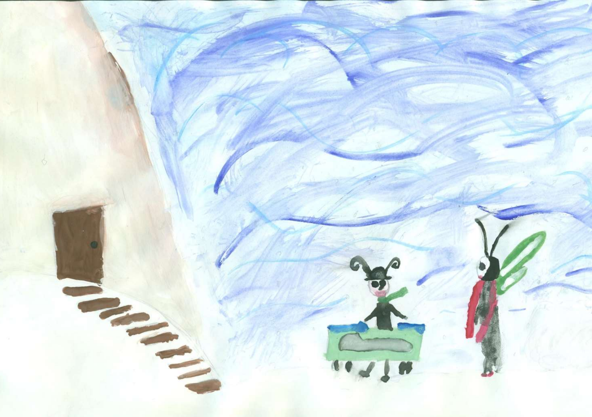
И. А. Крылов. «Басни. Стрекоза и муравей»