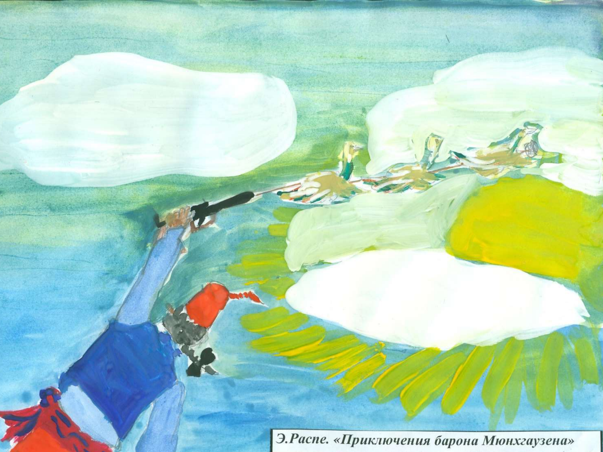
Э.Распе. «Приключения барона Мюнхгаузена»