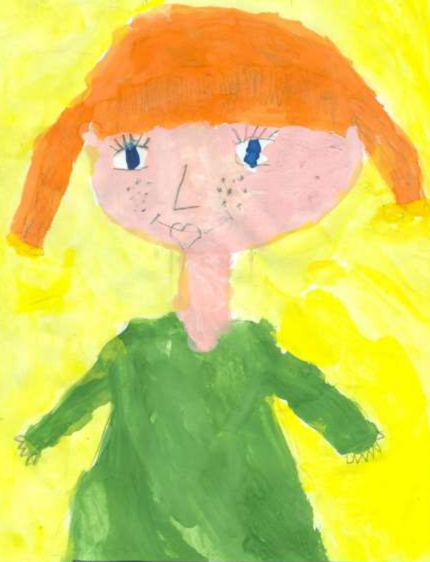
А. Линдгрен. «Пени-Длинный чулок»