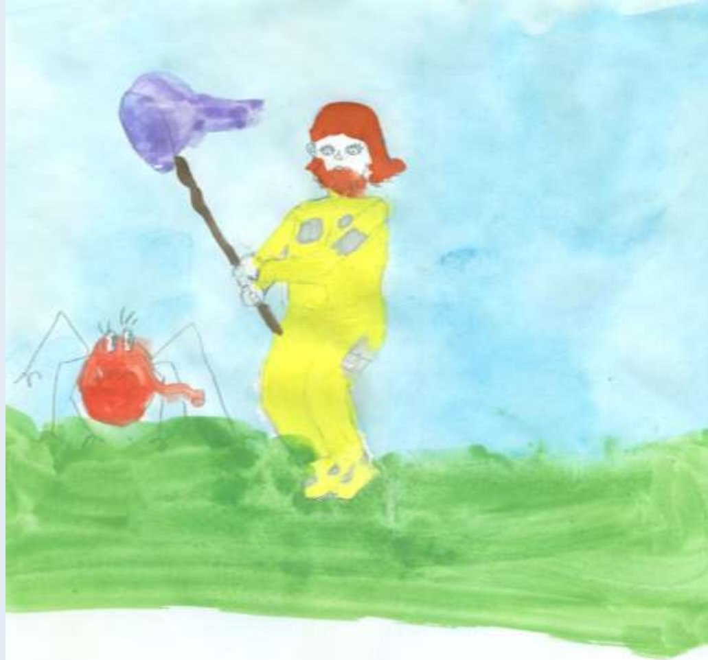
К. Булычев. «Девочка с Земли»