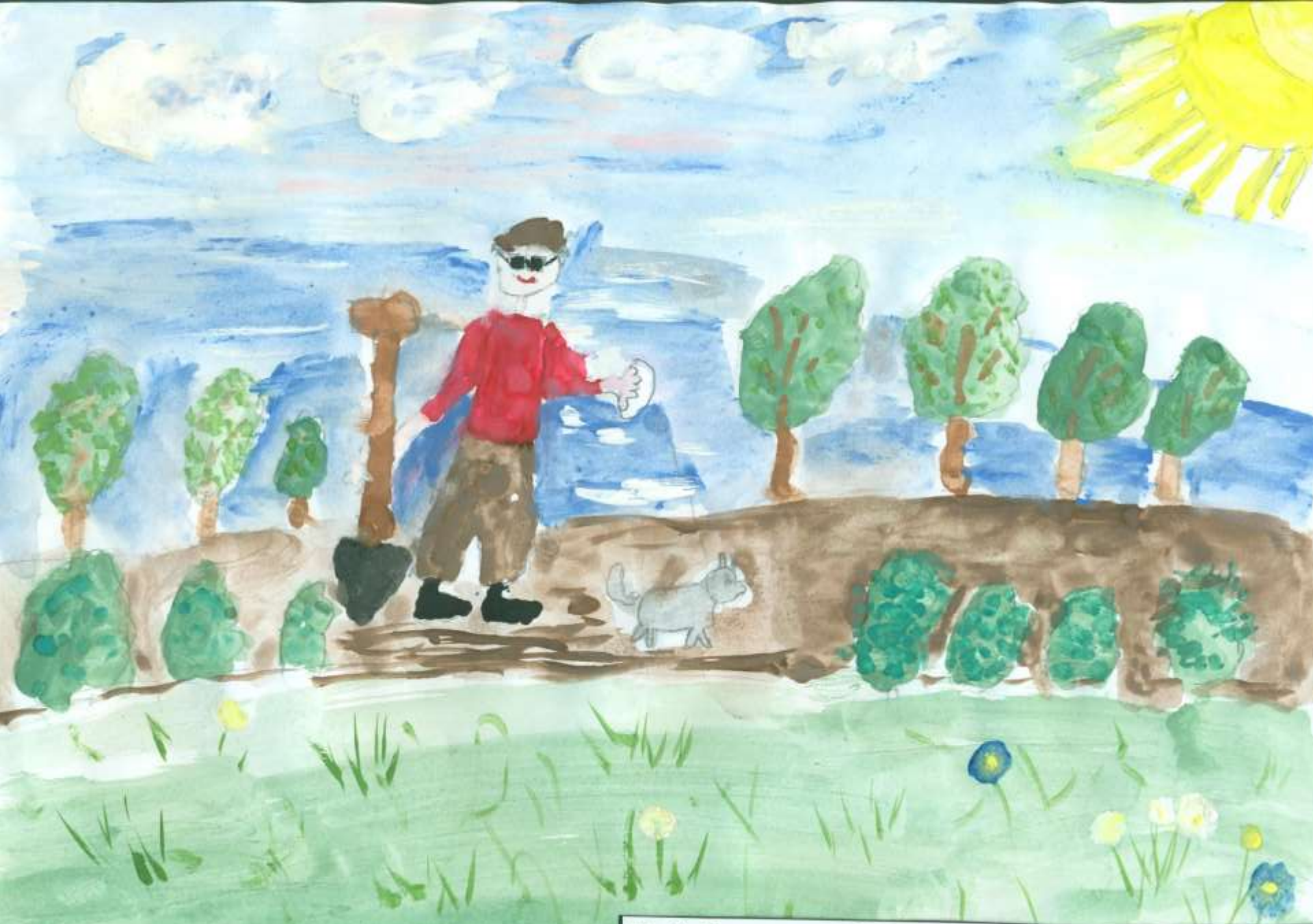
И. С. Тургенев. «Муму»