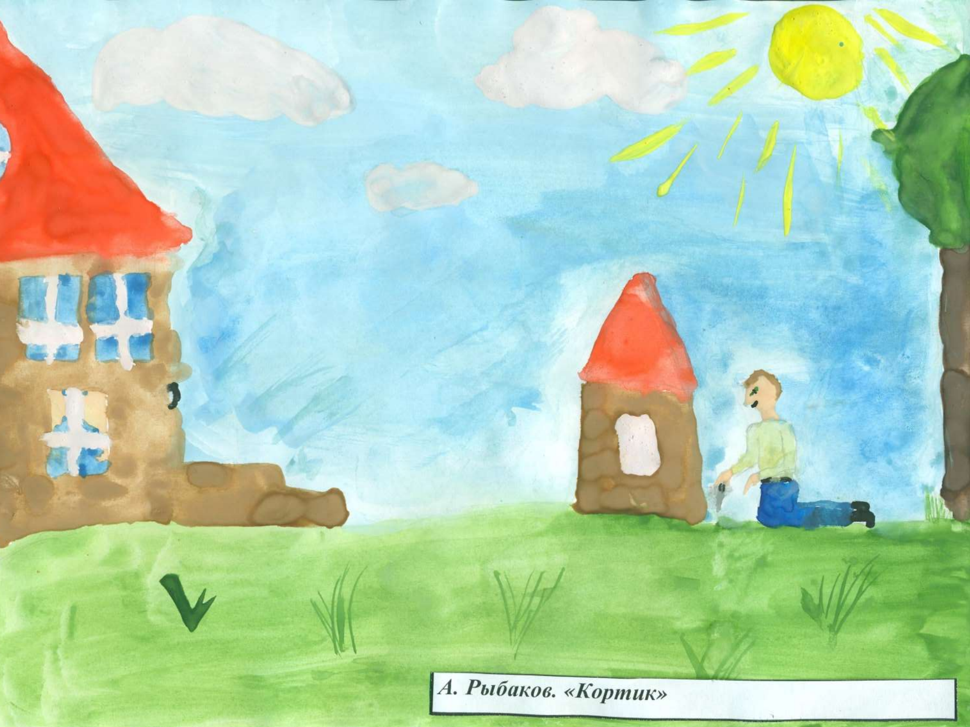
А. Рыбаков. «Кортник»