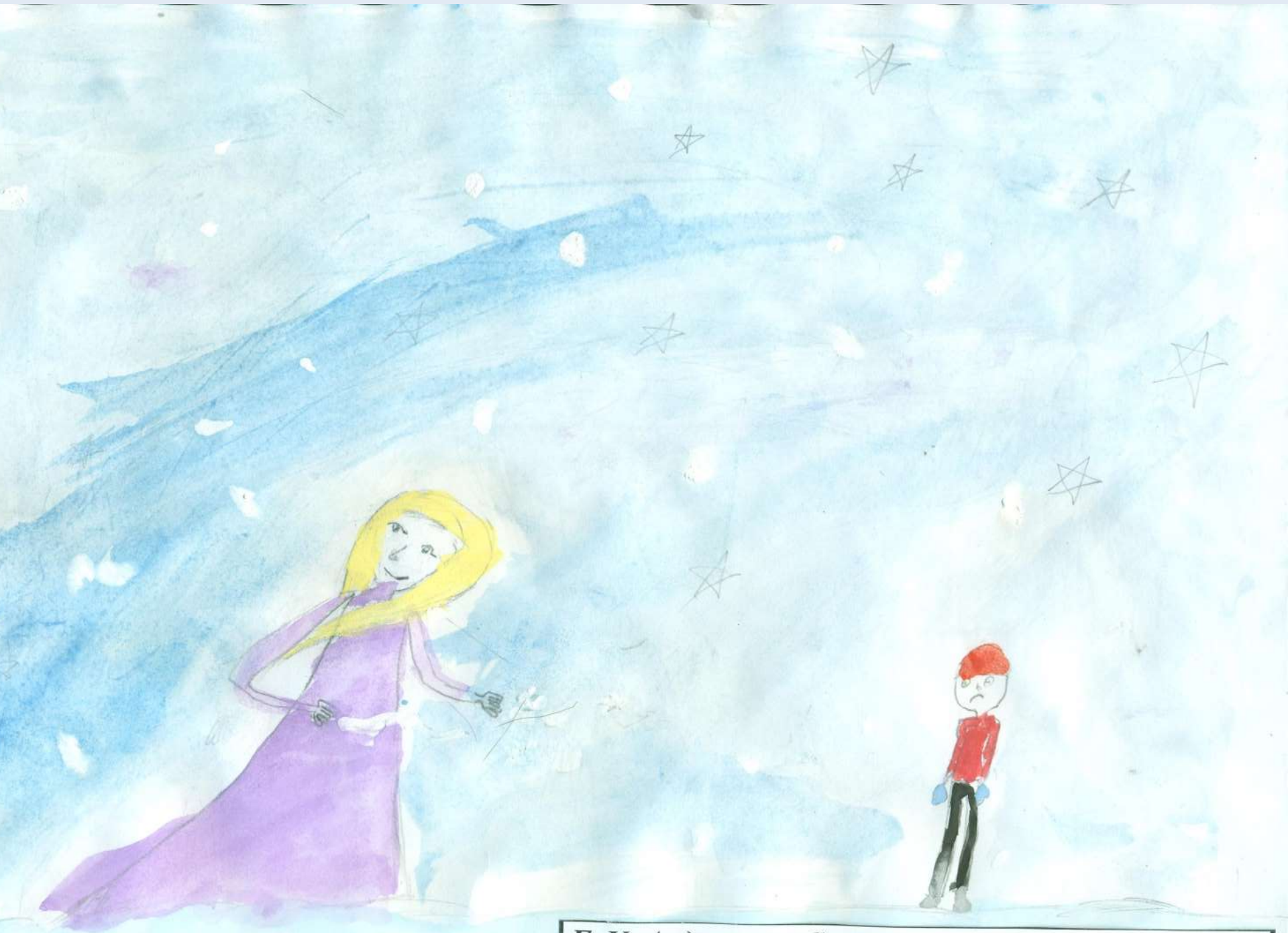
Г. Х. Андерсен. «Снежная королева»