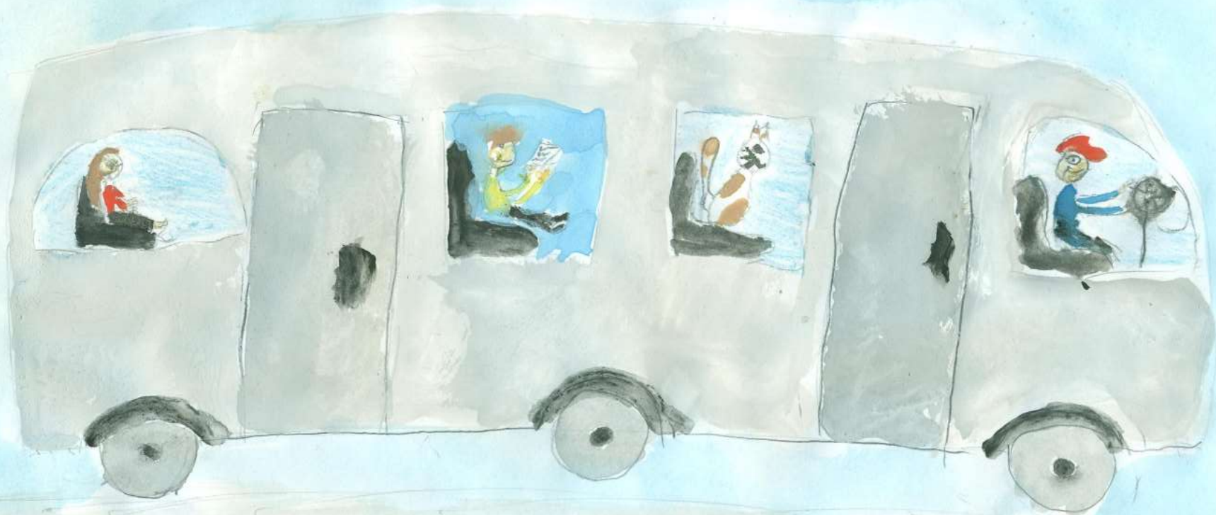
С. Финден. «Кот-путешественник»