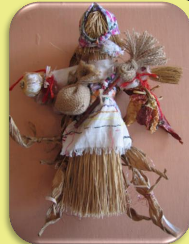
Куколка - оберег