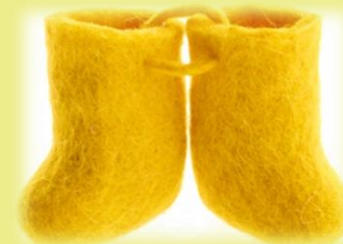
«Валеночки – шептуны» В них нашептывают свои желания.