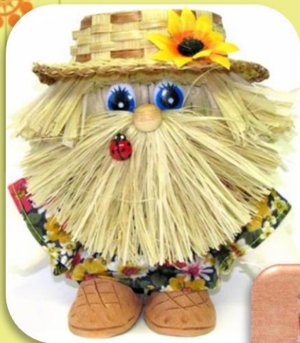
Домовой и мешочек с подарками