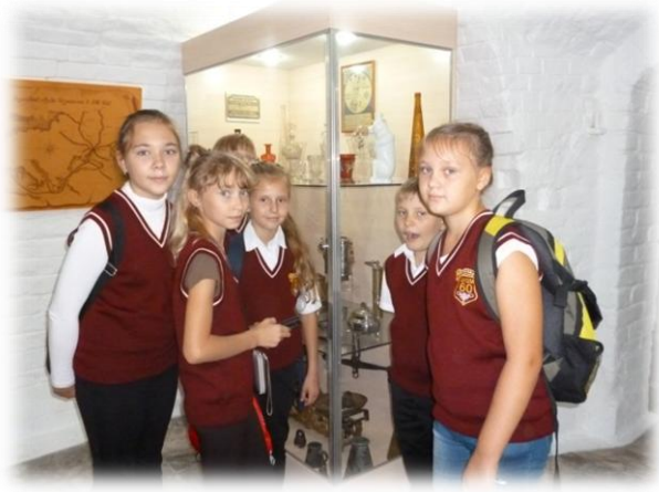
В музее находится вот такая большая модель Черкаска