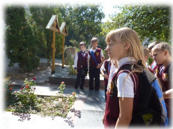
Трапезная атамана на атаманском подворье