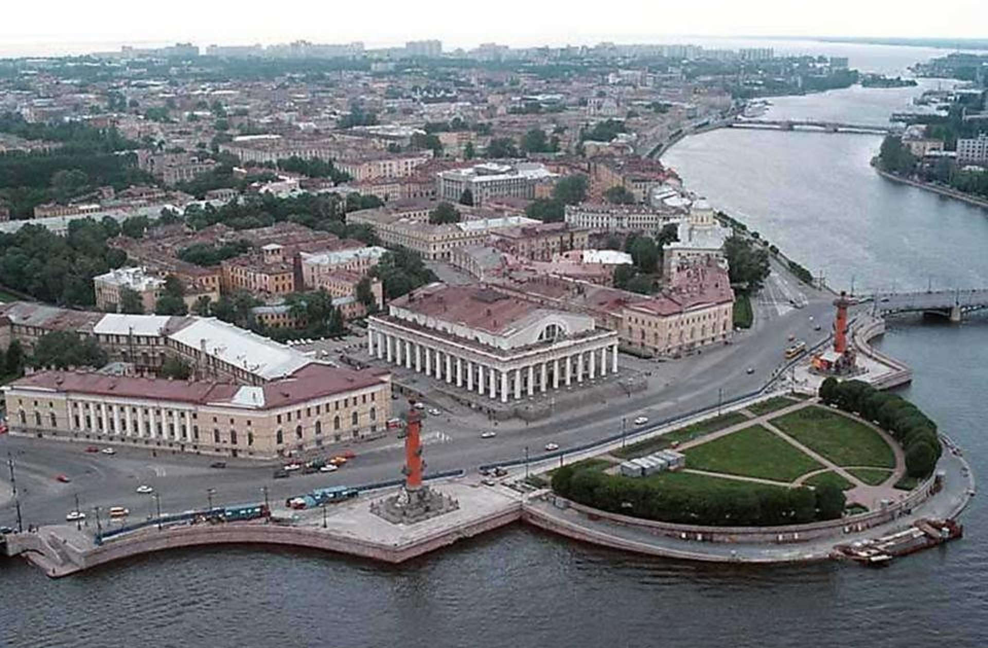
Стрелка Васильевского острова