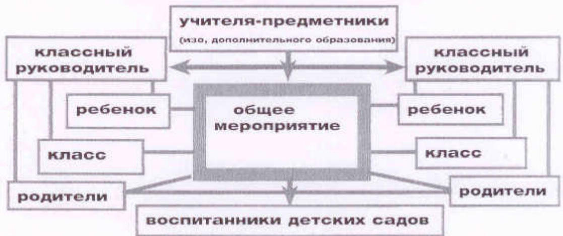
Схема сотрудничества в параллели по подготовке и проведению игры-путешествия:

эмоционального погружения и проживания темы детьми.