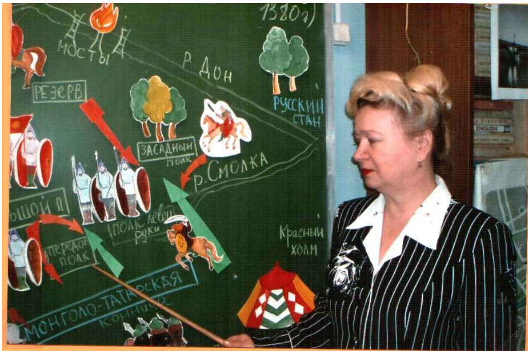
Вот так выглядит фрагмент использования аппликации при объяснении Куликовской битвы.