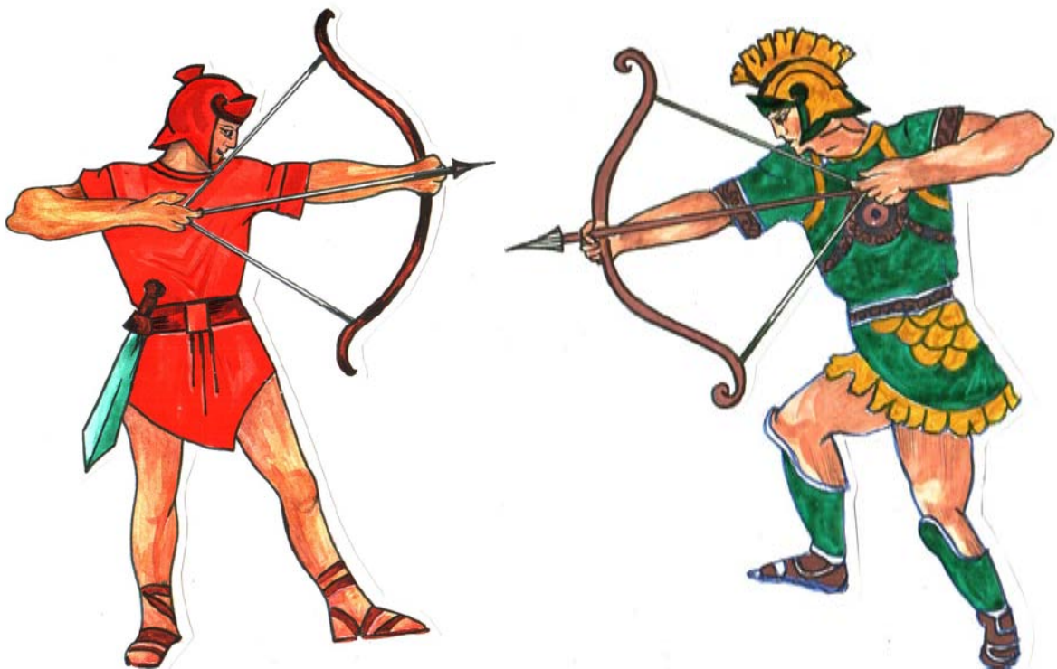
А это воины времен Пунических войн.