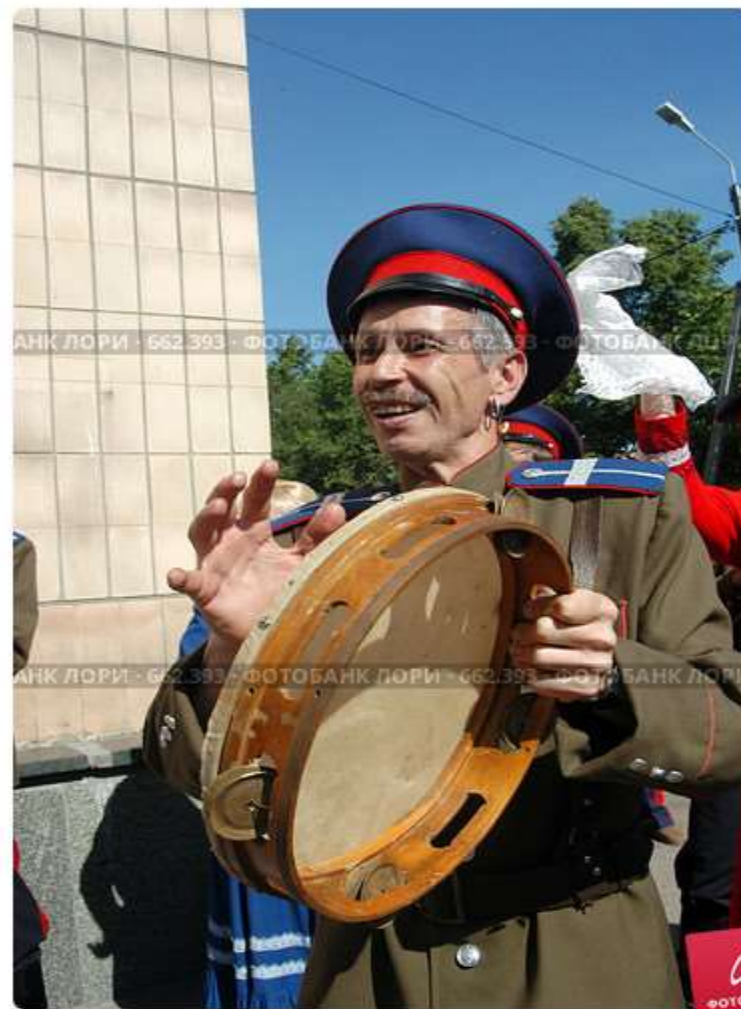
Казак играет на бубне