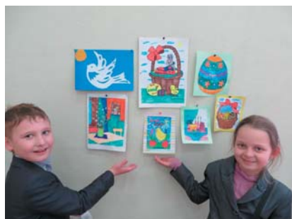
Творческие работы учащихся 2-3 классов