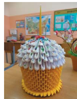
«Пасхальный кулич», Артем Скрипка, 3 «Б» класса