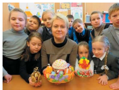
Творческие работы гимназисты подготовили вместе со своими педагогами 1-2 классов