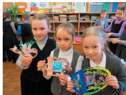
Творческие работы учащихся 1 «А» класса