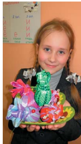
Коллективная работа кружковцев 3 «Б» класса