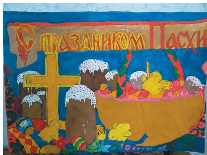
Коллективная творческая работа учащихся 4 классов