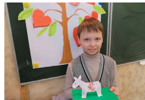
Творческие работы учащихся 2 «А» класса