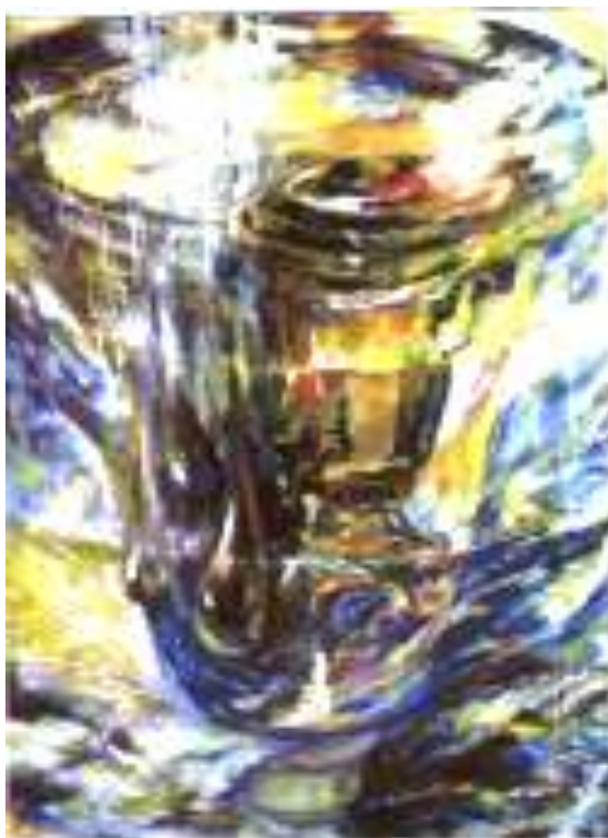
Космический самовар. 1995 г. Холст. Масло. Франтенко Т.А.

Происходящие события в нашей стране и вокруг неё объявляют востребованность планетарной концепции «Триединство целости». Сейчас образовательная система «наслаждается» компетентностным подходом. Применяются разного рода образовательные технологии, но в них нет Целости, а значит и системности. В настоящее время пока нет возможности в нашем колледже полнее развернуть действие Планетарной образовательно-педагогической технологии «Триединство Целости». Надеюсь, что она может заинтересовать! Мой адрес: Frantenkotpk@rambler.ru