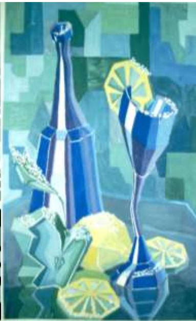
5. Замёрзшие предметы.