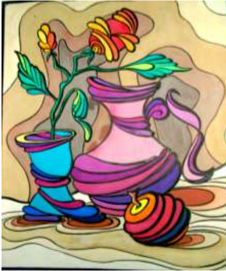
Натюрморты: 1. Танцующий.