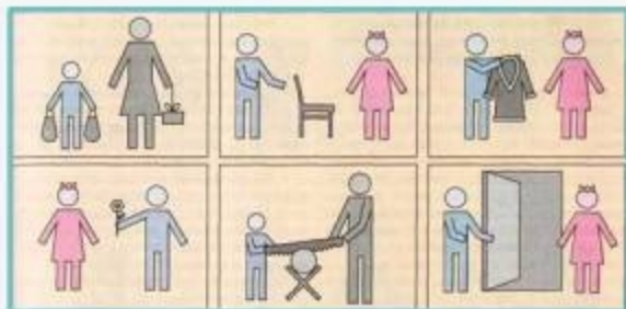
Схемы-действия поярорелевого поведения мальчиков