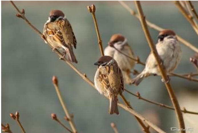
Воробьи сидят на ветке.

Расскажи, где находятся птицы. Составь предложения по образцу.