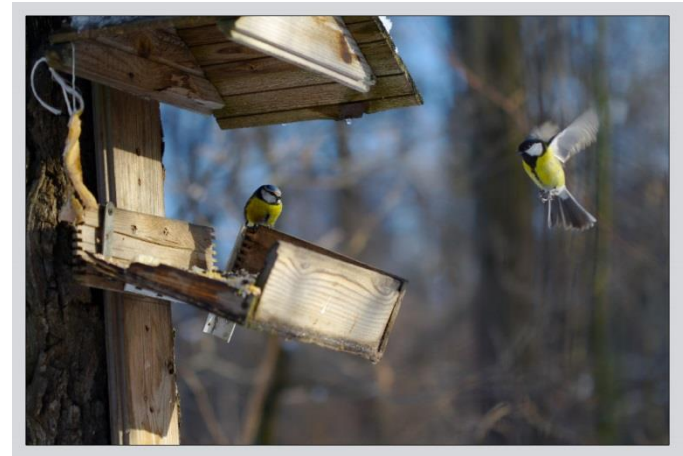
Синичка летит к кормушке.