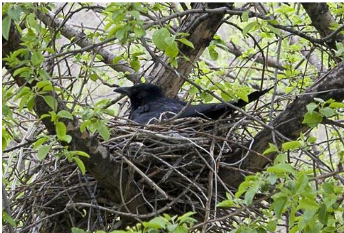
Ворона сидит в гнезде.