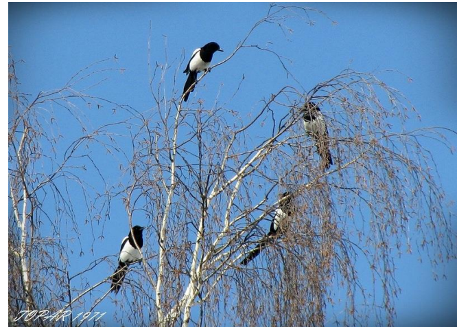
Сороки сидят на дереве.