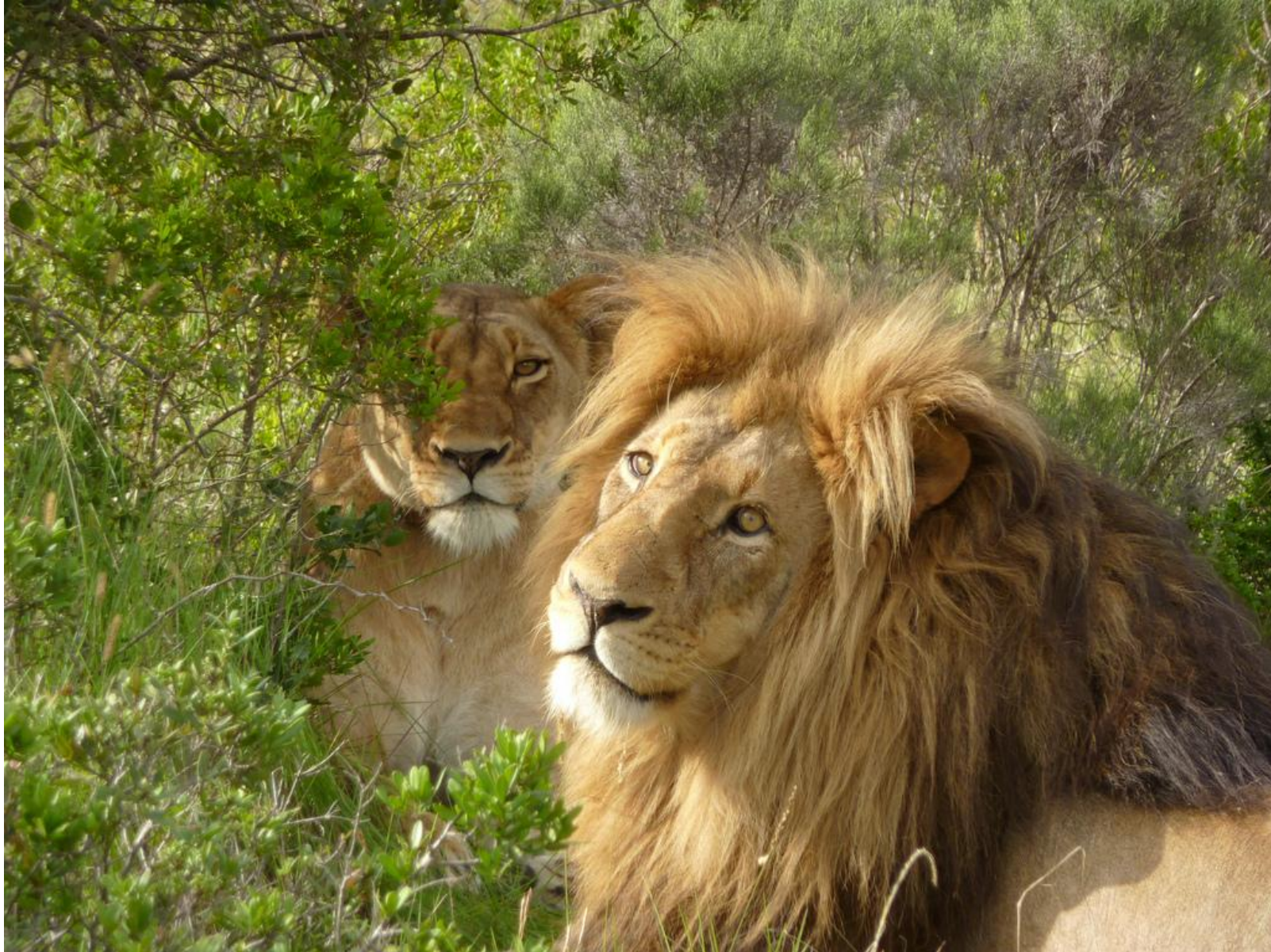
Лев и львица