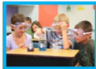
Иллюстрация: Юлия Ширкина, иллюстратор, МАДОУ «Я и Моя Семья» города Тюмени