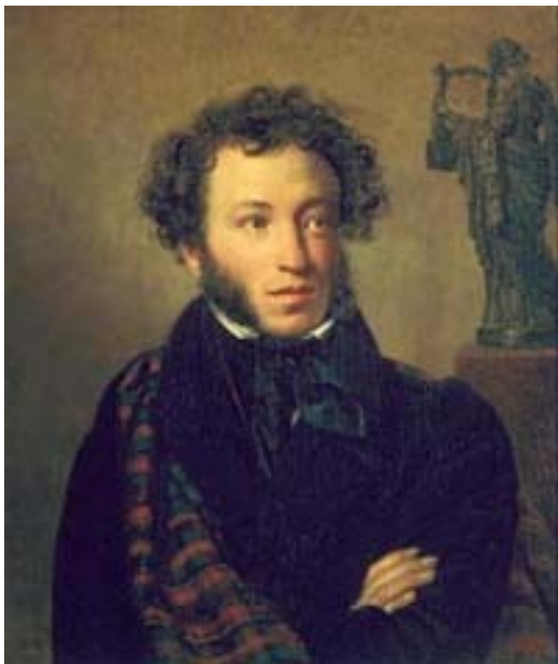
О.А. Кипренский. "Портрет Пушкина". 1827 г. Холст, масло. О поразительном сходстве портрета с Пушкиным говорили его современники. Так, например, Н.А. Муханов сказал: "С Пушкина списал Кипренский портрет необычайно похожий."