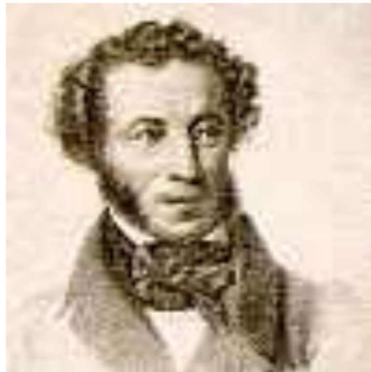
Т. Райт. "Портрет Пушкина". 1837 г. Гравюра на стали. В этом портрете И.Е. Репин подметил: "Обратите внимание(...) что в наружности Пушкина отметил англичанин. Голова общественного человека, лоб мыслителя, государственный ум."