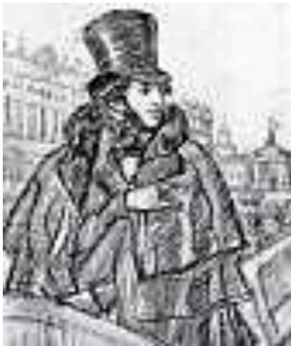
Б.М. Кустодиев. "Портрет А.С. Пушкина". 1915 г. Бумага, итальянский карандаш.

П.И. Челищев. "Пушкин и граф Д.И. Хвостов". Начало 1830г. Бумага, итальянский карандаш. Челищев обладал талантом карикатуриста. Он изобразил Пушкина крупным планом, во весь рост, широко шагающим. На заднем плане миниатюрная фигурка Хвостова, сгорбленная, на полусогнутых тонких ножках. Возникает образ гиганта Пушкина, идущего семимильными шагами, и малютки Хвостова, путающегося у него под ногами.