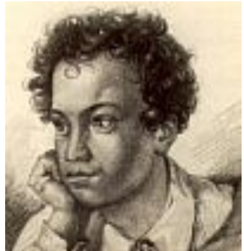
Гравюра на меди. Это первый портрет, который был опубликован в издании 1822г. "Кавказский пленник" в типографии А.И.Герча.