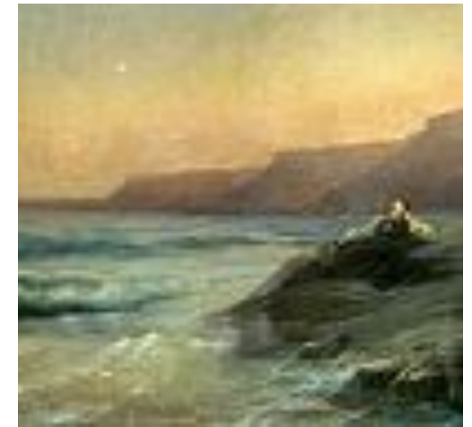
И.К. Айвазовский, "Пушкин на берегу Черного моря" 1887г. На одной из выставок в Петербурге (1836) встретились два художника - художник пера и художник кисти. Знакомство с Пушкиным произвело неизгладимое впечатление на молодого Айвазовского. "С тех пор и без того любимый мною поэт сделался предметом моих дум, вдохновения и длинных бесед и рассказов о нем", - вспоминал художник.