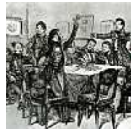
Пушкин среди декабристов в Каменке. Художник Д.Н Кардовский. 1934г.