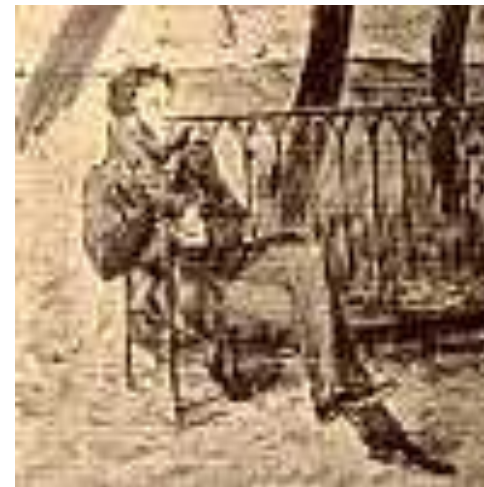
В.А. Серов. "Пушкин в парке".

Исследователи иконографии поэта спорят о том, в каком месте изображен серовский Пушкин: в Царском Селе или в деревне. Но важно ли это? Очень точно на этот вопрос ответил И.Е.Репин: "Серов, как Толстой, как Чехов, более всего ненавидел общие места в искусстве - банальность и шаблонность."