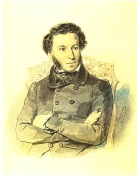
П.Ф.Соколов. "Портрет Пушкина". 1836 г. Бумага, акварель. Соколов изобразил Пушкина в его любимой позе со скрещенными на груди руками.