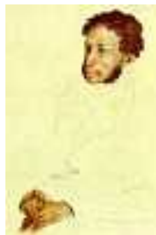
В.И. Шухаев. "Портрет Пушкина". 1960г. Бумага, пастель, сангина. Оригинал замышляет графического портрета: на листе бумаги художник плотно рисует сангиной, моделируя лицо и кисти рук поэта, а контуры фигуры лишь намечает одной линией, то - явной, то - сходящей на нет.