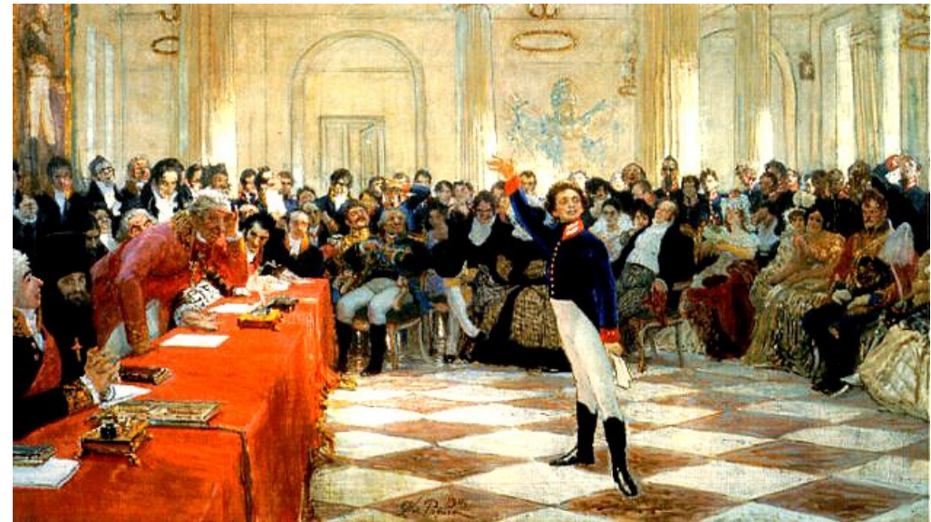
"Пушкин в Царском Селе", картина Ильи Репина, 1911.