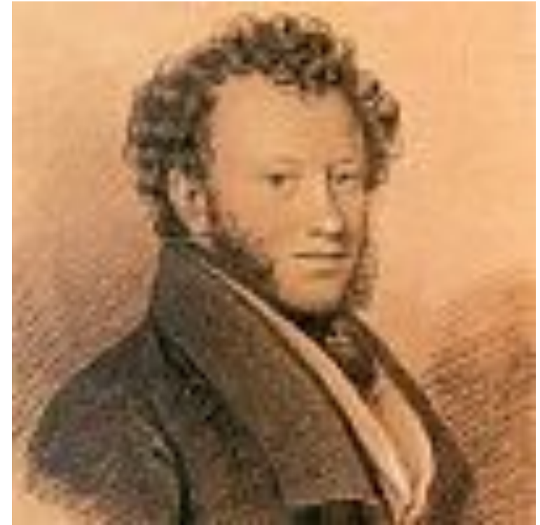
И.Е.Вивьен. "Портрет Пушкина". 1826 г. Бумага, итальянский карандаш, белила.