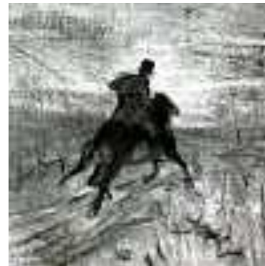
Пушкин на прогулке. Художник В.А. Серов. 1899 г.