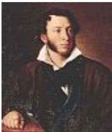
В.А. Тропинин. "Портрет Пушкина". 1827 г. Холст, масло. Портрет Тропинину заказал сам Пушкин и подарил его своему другу С.А.Соболевскому.