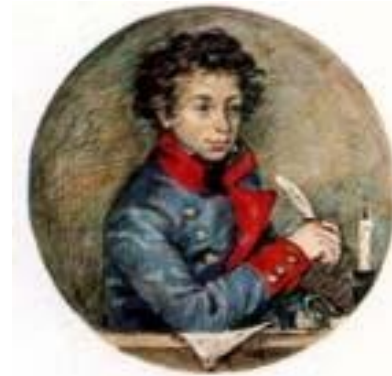
Саша Пушкин, лицеист. Художник Ю.В.Иванов.