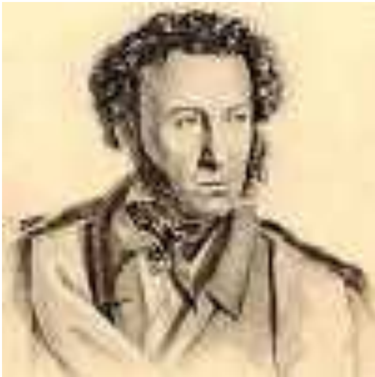
Г. Гиппиус. "Портрет Пушкина". 1828 г. Литография