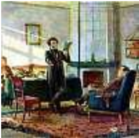
Пушкин в селе Михайловском (Пушин у Пушкина). Художник Н.Н. Ге. 1875 г.