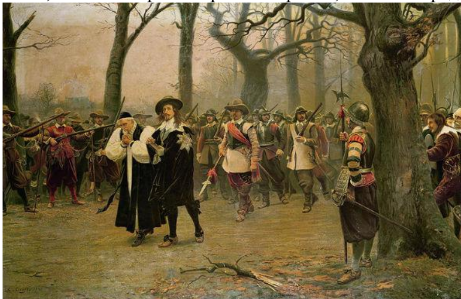
Эрнест Крофтс. Короля Карла I ведут на казнь.

преступника за то что в 1649 году Майлз, в числе 135 комиссаров парламента, обвинил короля Карла I в тирании, измене и предательстве.