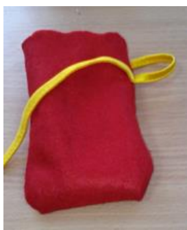
Рисунок 4 шаг №1