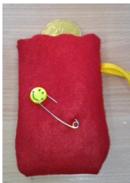
Рисунок 5 шаг №2