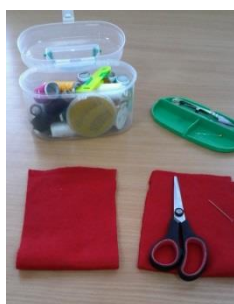
Рисунок 1 шаг №1