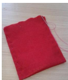
Рисунок 1 Шаг №2