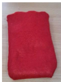
Рисунок 3 шаг №3