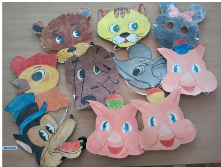
Маски из плотного картона